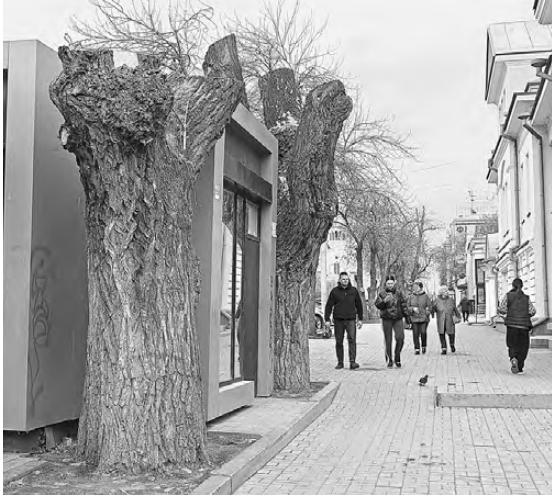
Варварски обрезанные тополя вообще перестают защищать горожан от пыли и выхлопных газов.

— Если мы хотим использовать основные леса как естественный фильтр для защиты от атмосферной пыли, необходимо, чтобы ширина защитных зеленых участков была не менее 100 метров, а лучше — 150–200 и более. Очевидно, что участки основных лесов меньшего размера не будут эффективно перехватывать потоки загрязняющих веществ, — считает исследователь. ●