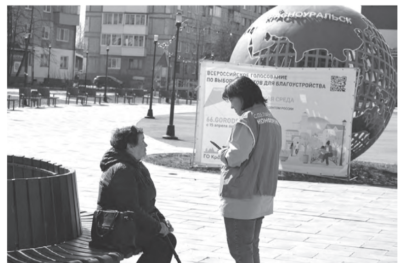
Волонтер помогает проголосовать

Напомним, что для голосования представлены два объекта: