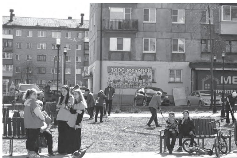
Сквер по ул. Ленина

«Третья горка», так же как и сквер по ул. Ленина и «Парк искусств», была благоустроена в рамках федерального проекта