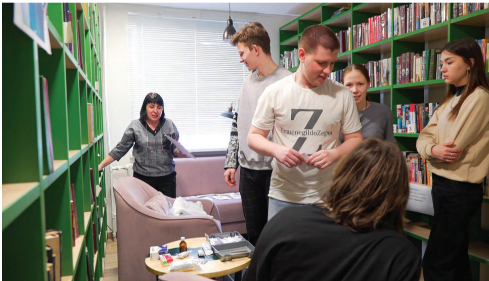
На станции «Медицина»

где они попробовали себя в роли дизайнеров, шеф-поваров, медицинских работников и т.д. Всего в ходе профориентационного мероприятия ребята посетили пять станций – «Медицина», «Легкая промышленность», «Туризм», «Пищевая промышленность», «Культура и искусство». Здесь участники квеста учились собирать аптечку первой помощи, готовить холодные блюда, пытались постичь дизайнерское искусство, а также демонстрировали свои познания в области живописи, музыки и кино.