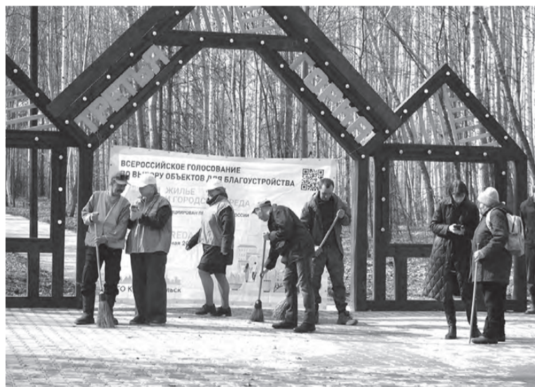
Парк «Третья горка»

волонтеров собралась на субботник в парке «Третья горка», который появился в нашем горо-