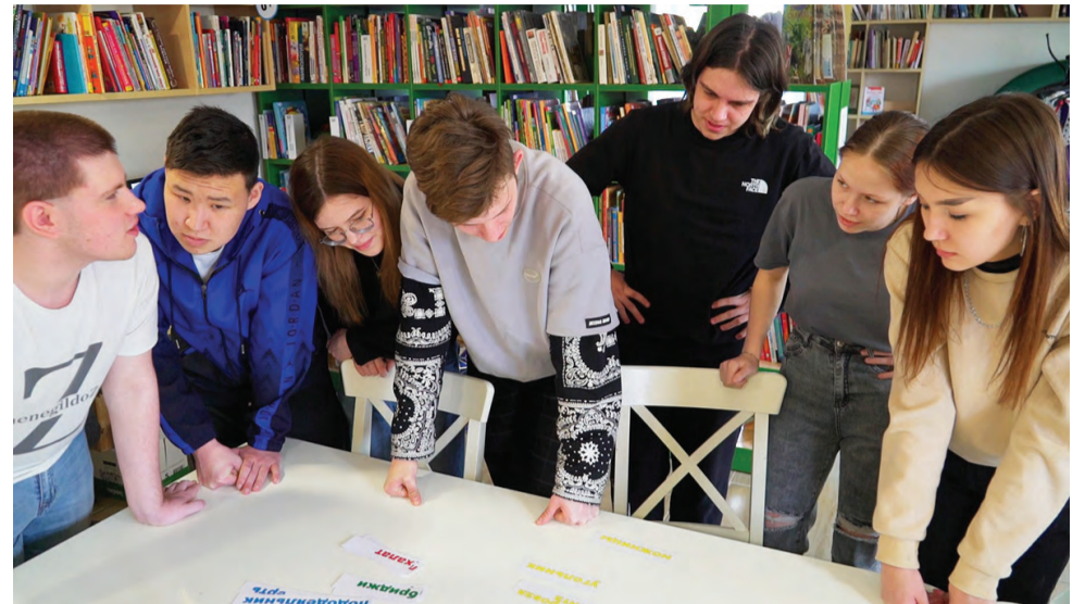
На станции «Легкая промышленность»

Закрепить полученный материал будущие выпускники школ смогли в ходе увлекательного путешествия по локациям,