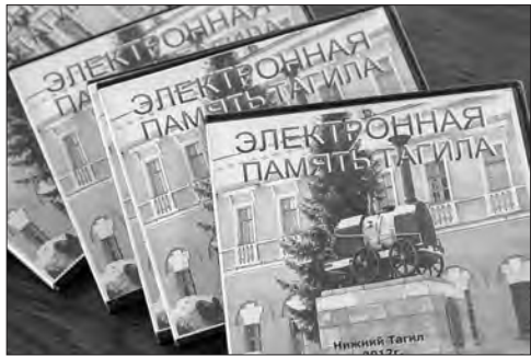
Новое краеведческое издание «Электронная память Тагила».

Проект, получивший название «Электронная память Тагила», был выдвинут на городской конкурс на получение субсидий из средств местного бюджета и, конечно, вошел в число победителей. И началась кропотливая работа: с мая по октябрь сотрудники библиотеки просматривали старые подшивки газет начиная с 1984 года, когда впервые появилась