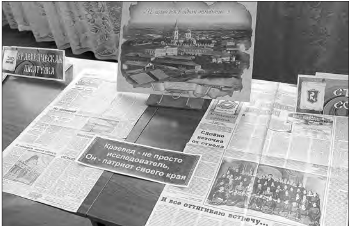
Фрагмент выставки в библиотеке во время презентации электронного издания.

Так как в 2012 году Нижний Тагил отмечает свое 290-летие и внимание к истории города все возрастает, клуб и библиотека решили создать электронное издание с уникальными материалами из рубрик «Краеведческая шкатулка» и «Старый соболь». Да, «Соболь» – детище «Горного края». Но, во-первых, газета (до ее закрытия) вместе с «Тагильским рабочим» входила в состав нашей информационной компании «Тагил-пресс», а, во-вторых,