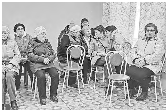
Таличане организуют сход в школе

Депутаты вернулись со сходов с наказами сельчан, которые им предстоит озвучить на профильных комиссиях.