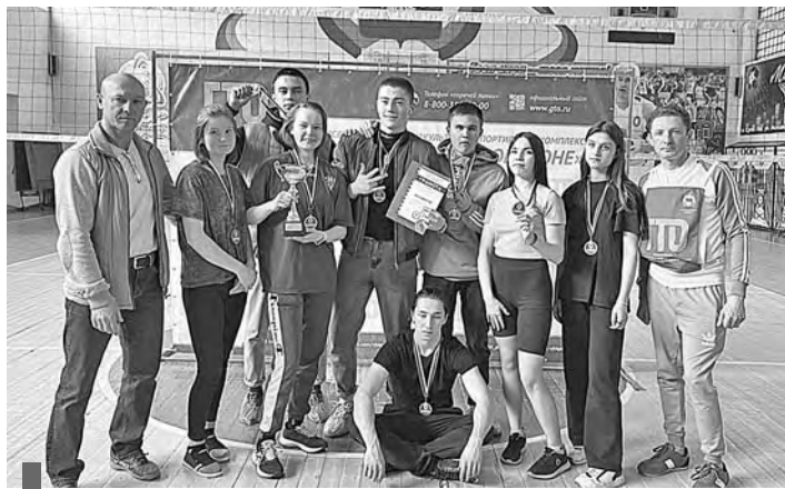
Команда СМТ – победитель фестиваля ГТО

баллов (2025) набрала команда Сухоложского многопрофильного техникума (СМТ). Представители сухоложского филиала Уральского промышленно-экономического техникума (УПЭТ) с 1921 баллом заняли второе место. Третий результат – 1864 балла – у