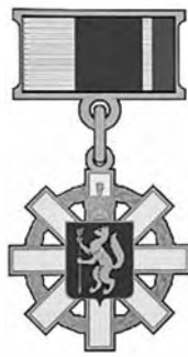
Знак отличия «Трудовая доблесть Урала»

Работа над текстом законопроекта была непростой. В ней принимали участие члены комитета по региональной политике и развитию местного самоуправления Заксобрания, представители Уральского института регионального законодательства, Федерации профсоюзов Свердловской области и эксперты Геральдиче-