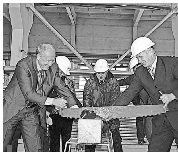
Распиловка импровизированной сваи

Церемония продолжилась ручной распиловкой импровизированной сваи и автоматизированной