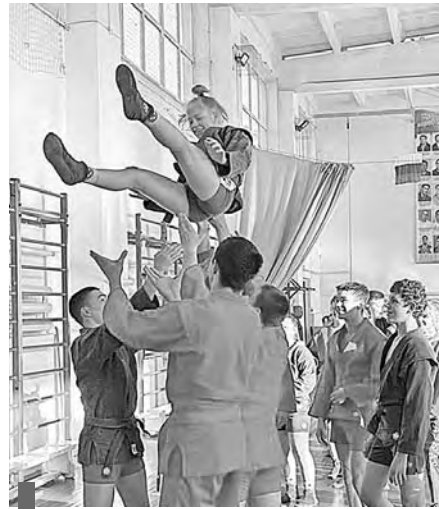
Так Алину поздравили с победой дома

Коллектив спортивной школы благодарит родителей Алины за поддержку в ее спортивных начинаниях. Желает самбистке и тренеру исполнения всего задуманного.