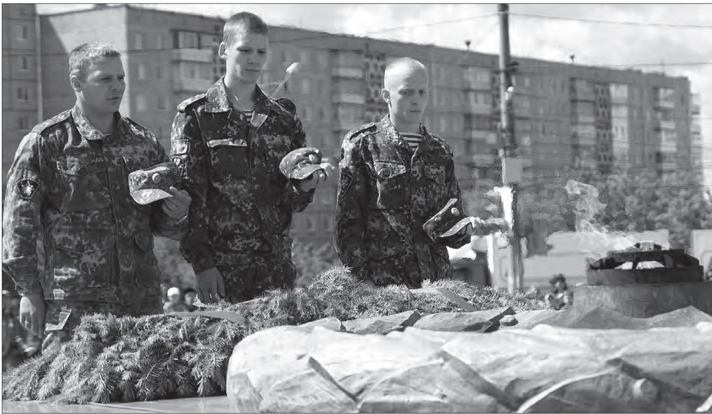
Спецназовцы 12-го отряда «Урал» возложили венки.