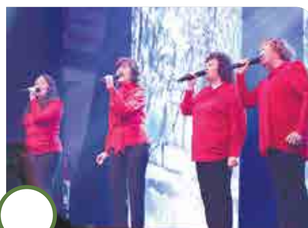
ВОКАЛЬНЫЙ АНСАМБЛЬ «ВДОХНОВЕНИЕ» Полевской