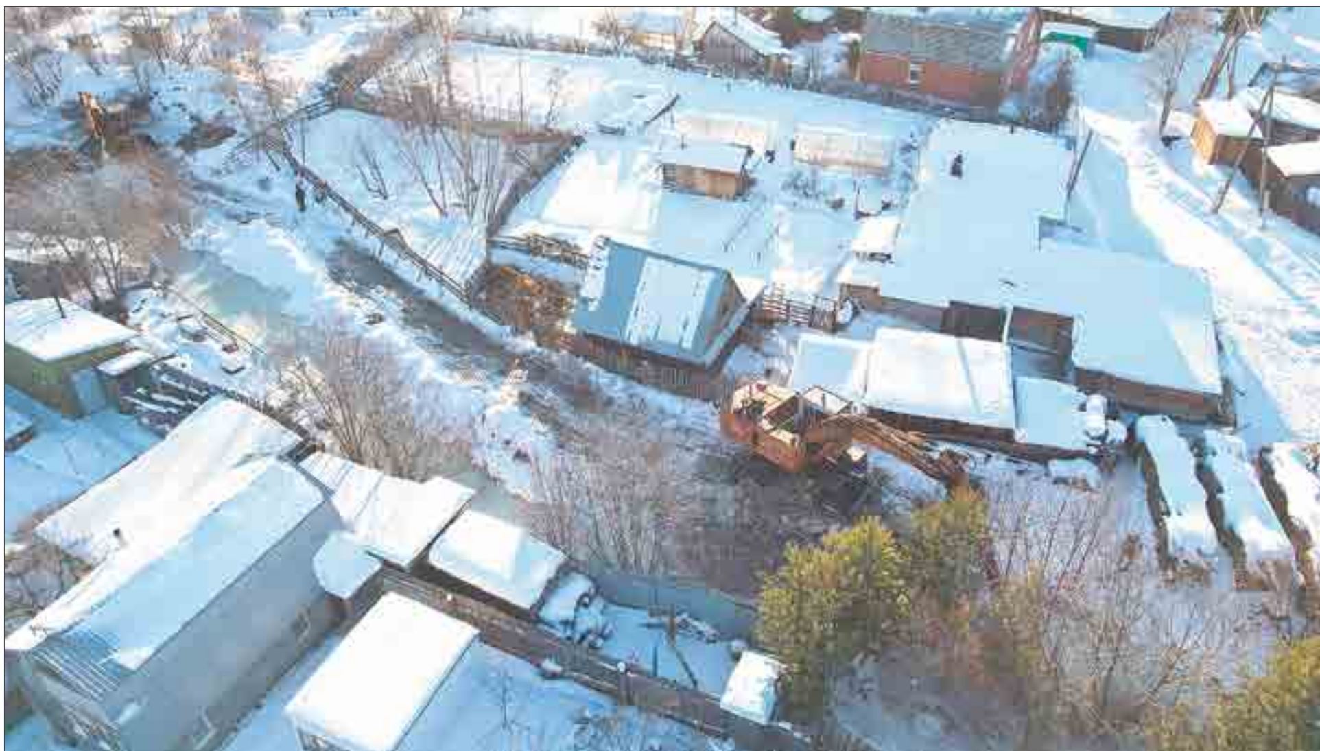
Вот на этой фотографии хорошо видно, что хозяйственные постройки на улице Циолковского, 2 стоят слишком близко к реке. Возможно, это тоже еще одна причина того, что их заливает водой.