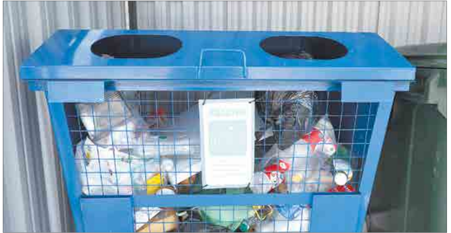
Контейнеры установили совсем недавно, но, как мы видим, сортировка мусора у ревдинцев получается не очень — пакеты накинаны явно не с пластиком.