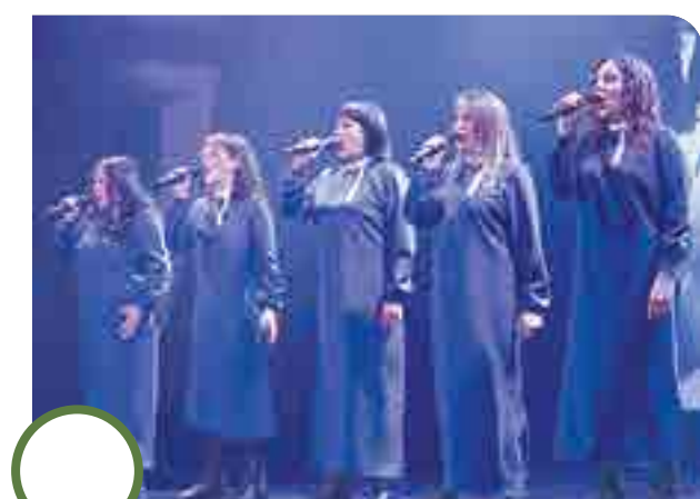
АНСАМБЛЬ «ВИЗАВИ» Верхняя Тура