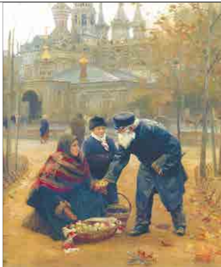
«Добрый дедушка» // Картина Николая Касаткина (1859-1930)