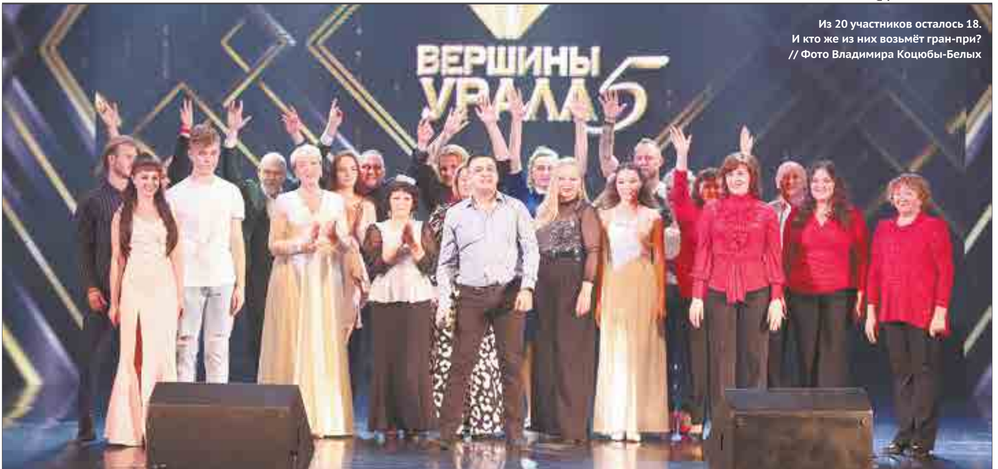
Из 20 участников осталось 18. И кто же из них возьмёт гран-при?