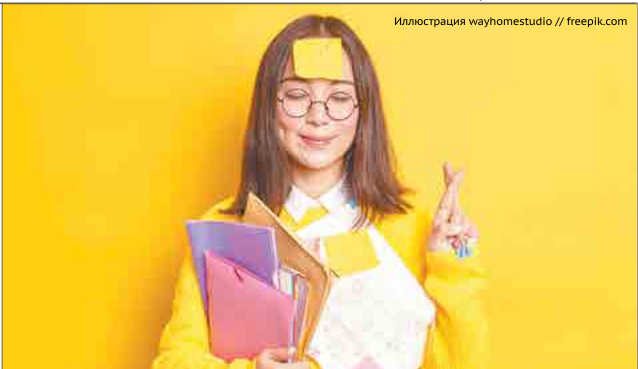
Иллюстрация wayhomestudio // freepik.com