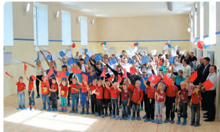
↑ Открытие зала дзюдо в Бисерти, 2017 год

Дворец дзюдо – четырёхэтажное здание, визуально приподнятое над уровнем земли. Внешний вид напоминает ворота Тории – один