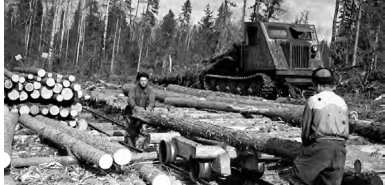
Леспромхоз в Бисерти начал работать в конце сороковых