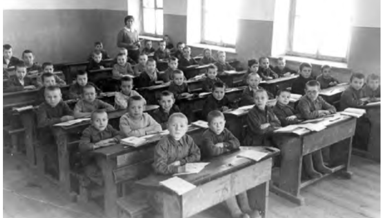
Примерно такой была в сороковых годах Железнодорожная школа

мо напротив железной дороги, то школьники из своих классов во время уроков видели, как идут нескончаемым потоком на Запад эшелоны с военной техникой и эшелоны с фронтовиками. А потом, спустя четыре года, когда уже окончилась Великая Отечественная война и отгремела салютами Победа - почти на таких же поездах и в тех же вагонах (только уже празднично украшенных) с фронта возвращались солдаты-победители, бравшие Берлин и освобождавшие Европу.