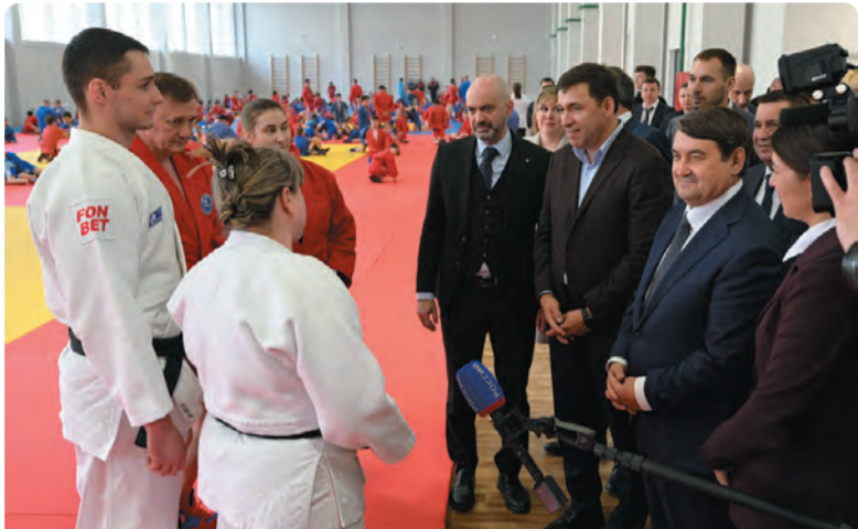
Игорь Левитин и Евгений Куйвашев с юными дзюдоистами ↑

Евгений Куйвашев открыл в Екатеринбурге Дворец дзюдо, в нём смогут одновременно заниматься сотни человек.