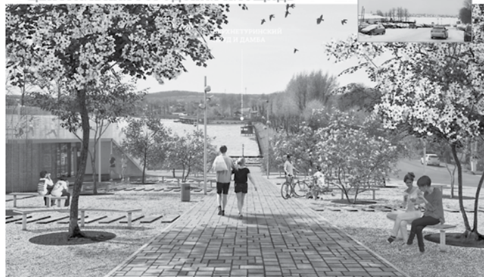
ЗАВЕРШЕНИЕ УЛИЦЫ ЦЕНТРАЛЬНАЯ ГОРОДСКАЯ ПЛОЩАДЬ

В перечень общественных территорий, предлагаемых для рейтингового голосования на территории ГО Верхняя Тура входят: