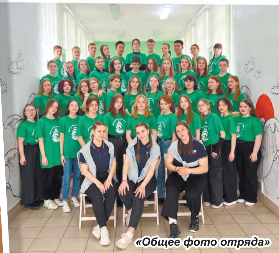
«Общее фото отряда»