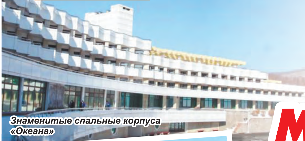
Знаменитые спальные корпуса «Океана»