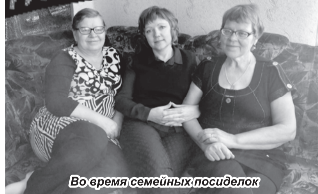
Во время семейных посиделок