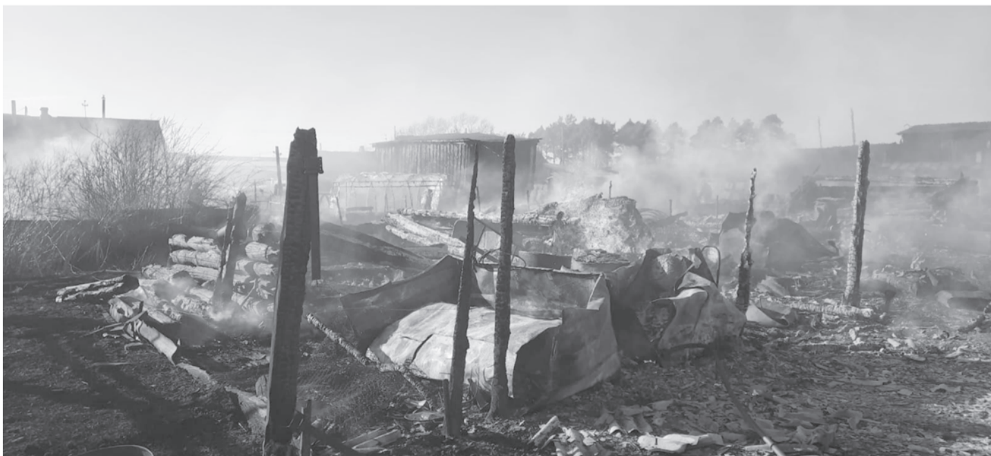
Полоса подготовлена при финансовой поддержке Министерства цифрового развития, связи и массовых коммуникаций РФ.

Е. Малова На снимках пожар в п. Пионерском, 9 апреля