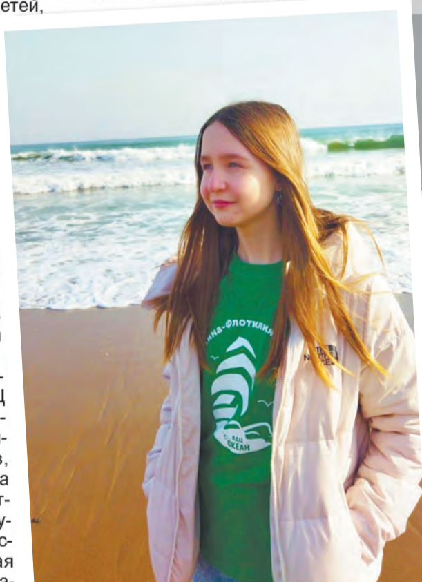
Полоса подготовлена при финансовой поддержке Министерства цифрового развития, связи и массовых коммуникаций РФ.

Для начала я прошла регистрацию и заполнила анкету, приложила пакет документов, загрузила свои достижения. За каждое достижение начисляются баллы, от этого зависит прохождение по рейтинговой таблице, чем больше баллов, тем выше шанс получить путёвку. В один прекрасный день мне пришло сообщение на почту о том, что я получила путёвку в «Океан» на четвёртую смену на программу «В мире естественных наук», чему я была несказанно рада. Путёвка в «Океан» - это путёвка в сказочный город детства! В город, где жизнь насыщена яркими событиями, удивительными открытиями, морем улыбок и, конечно же, встречами с интересными людьми. Всего в «Океане» есть 5 дружин: Океанская эскадра, Бригантина, Парус, Тигрёнок и Китёнок, а в скором времени начнётся строительство дружины Галак-