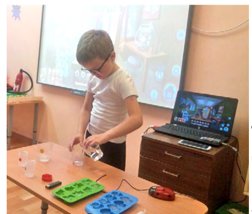
Фото: Детский сад «Сказка»