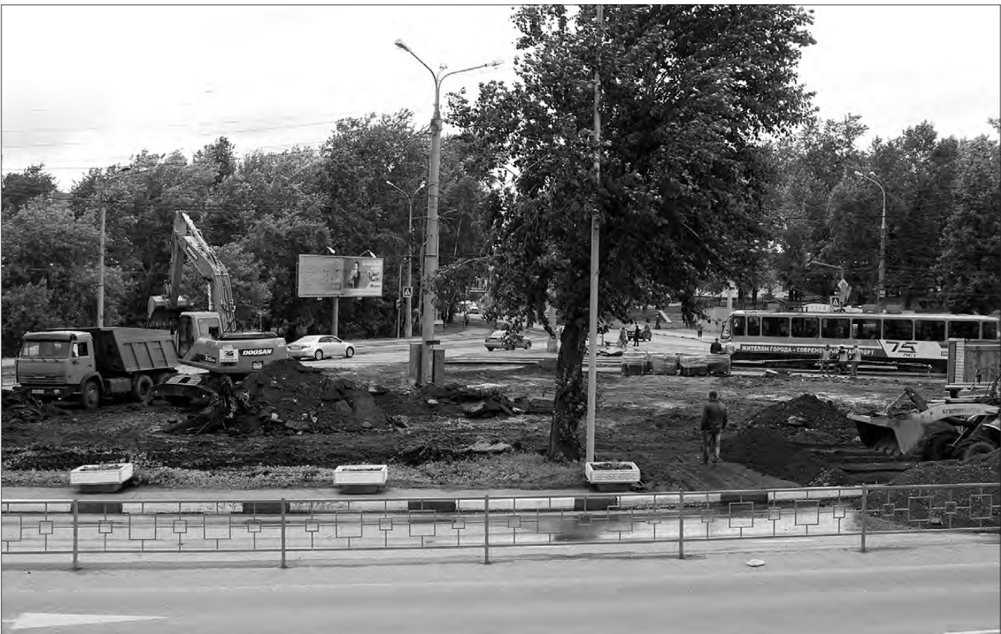
Тагильчане получат еще одну зеленую зону для отдыха.