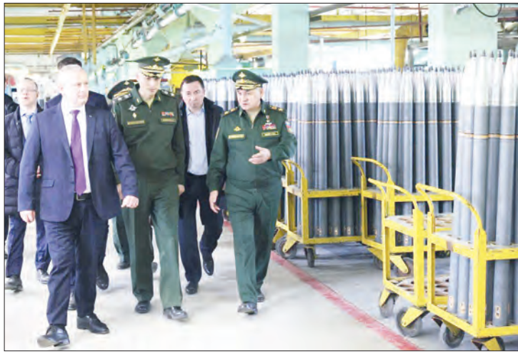
Реализация этих проектов уже позволила предприяти-

Руководители предприятий доложили Сергею Шойгу о текущих результатах выполнения государственного оборонного заказа, а также о реализуемых предприятиями проектах по модернизации и расширению производственных мощностей и повышению производительности труда.