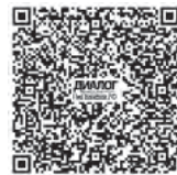
ВИДЕО на сайте ПроПолевской