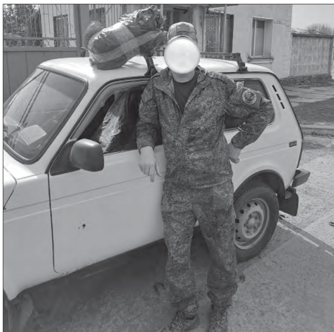
В ходе поездки были переданы именные посылки и гуманитарная помощь