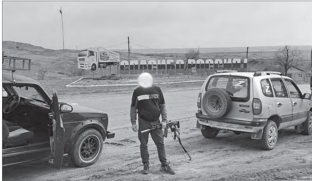
Два автомобиля «Нива» для бойцов СВО волонтеры перегнали из Полевского в ЛНР. Их путь лежал через Тольятти, Волгоград, Каменск-Шахтинский

Полевские предприниматели купили два автомобиля повышенной проходимости и перегнали их в зону СВО