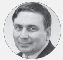
Николай СМОРНОВ , министр энергетики и ЖКХ Свердловской области:

– Вид данной площадки говорит о том, что было бы неплохо и здесь навести порядок. Данная территория может быть