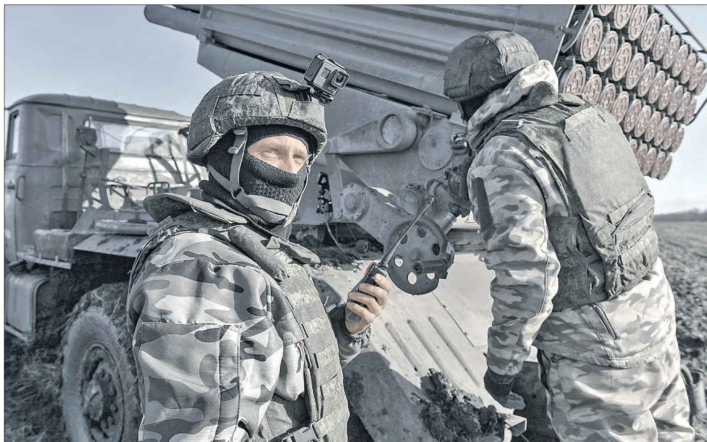
Получает высокую оценку командования боевая работа расчётов реактивных систем залпового огня «Град» и «Ураган» Центрального военного округа, выполняющих задачи в зоне проведения специальной военной операции.

ПОДРАЗДЕЛЕНИЯ ВООРУЖЁННЫХ СИЛ РОССИИ ПРОДОЛЖАЮТ УСПЕШНО ВЫПОЛНЯТЬ БОЕВЫЕ ЗАДАЧИ В ХОДЕ СПЕЦИАЛЬНОЙ ВОЕННОЙ ОПЕРАЦИИ