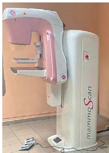
Современный цифровой маммограф - для больницы очень важное

В том числе, капитально отремонтированная поликлиника Бисертской горбольницы. За этим знаком новая высокотехнологичная аппаратура для нашей больницы. Всё это - Нацпроект «Здравоохранение».