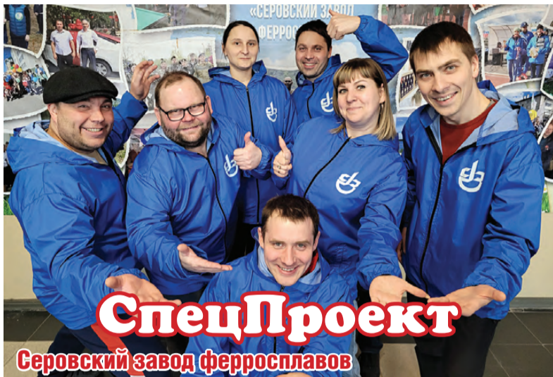
Серовский завод ферросплавов

Дмитрий СКРЯБИН Снимки предоставлены участниками Кубка КВН