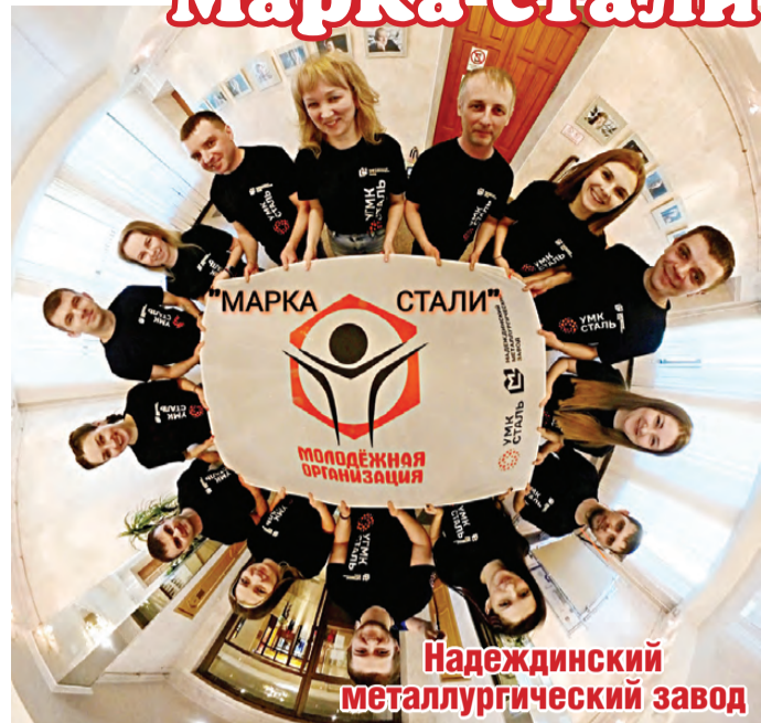
Надеждинский металлургический завод