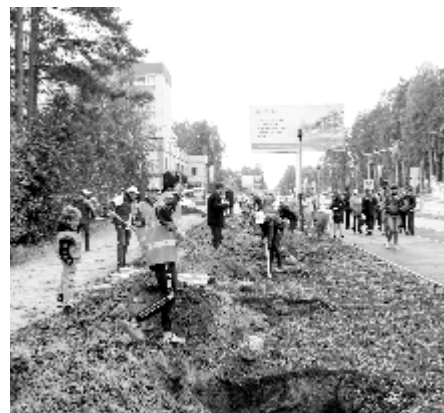
Озеленение улицы Ленинградской