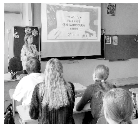
Уроки профориентации в школах