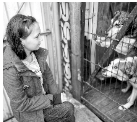
Уроки доброты в приютах