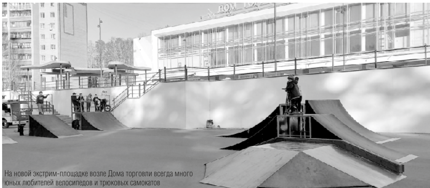
На новой экстрим-площадке возле Дома торговли всегда много юных любителей велосипедов и трюковых самокатов

На днях 45-летний обеспеченный зареченец, отец трёх пацанов решил посоветоваться: «Скоро лето, мои ребята электросамокат просят, говорят, у многих одноклассников такие есть, мол, многоскоростные велосипеды - это уже прошлый век. Купить что ли?..»