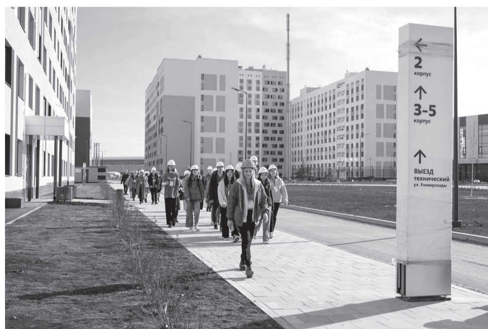
Экскурсия по строящемуся кампусу

В непосредственной близости от общежитий возведен Дворец водных видов спорта – крупнейший и самый современный в России. Он сможет принимать соревнования по плаванию, водному поло, прыжкам в воду и синхронному плаванию. С трибун наблюдать за выступлениями спортсменов смогут более 5 тысяч зрителей. Общая площадь объекта – 61 тысяча квадратных метров. Всего