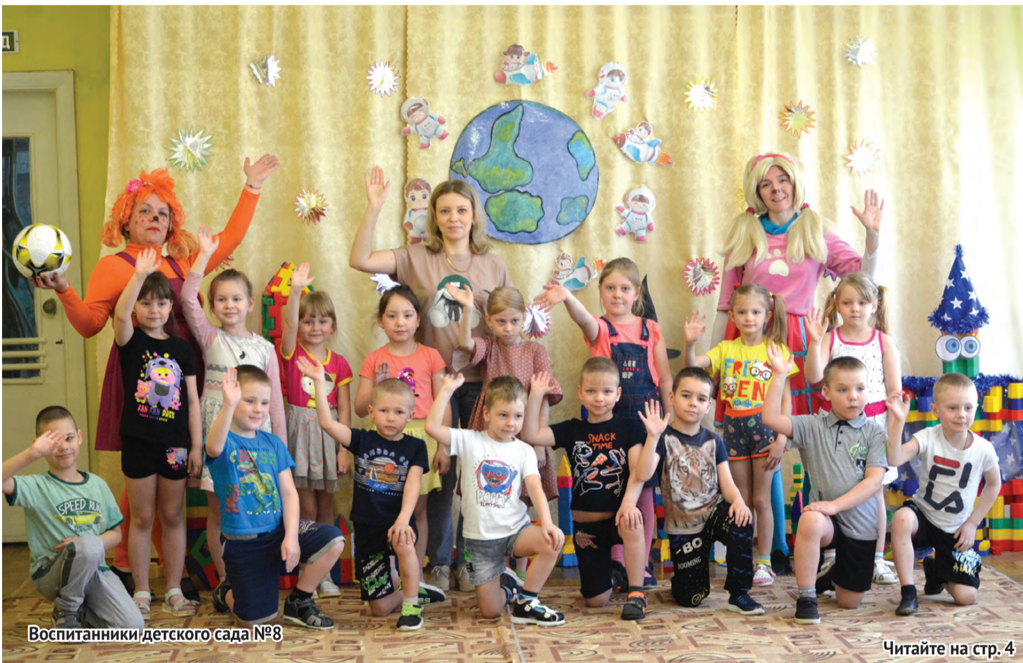
Воспитанники детского сада №8