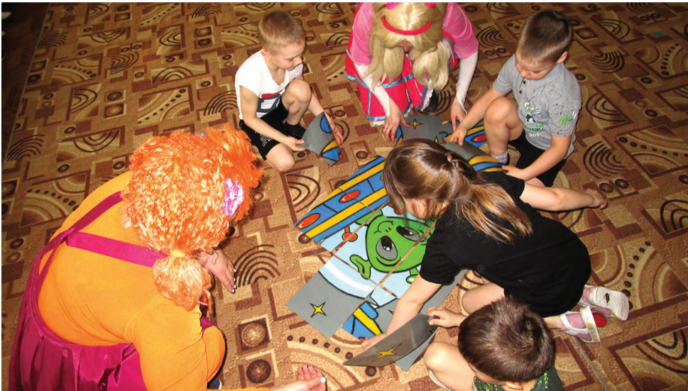
Собрать портрет инопланетянина было непросто

Справиться со всеми испытаниями мальчишкам и девчонкам помогли ге-