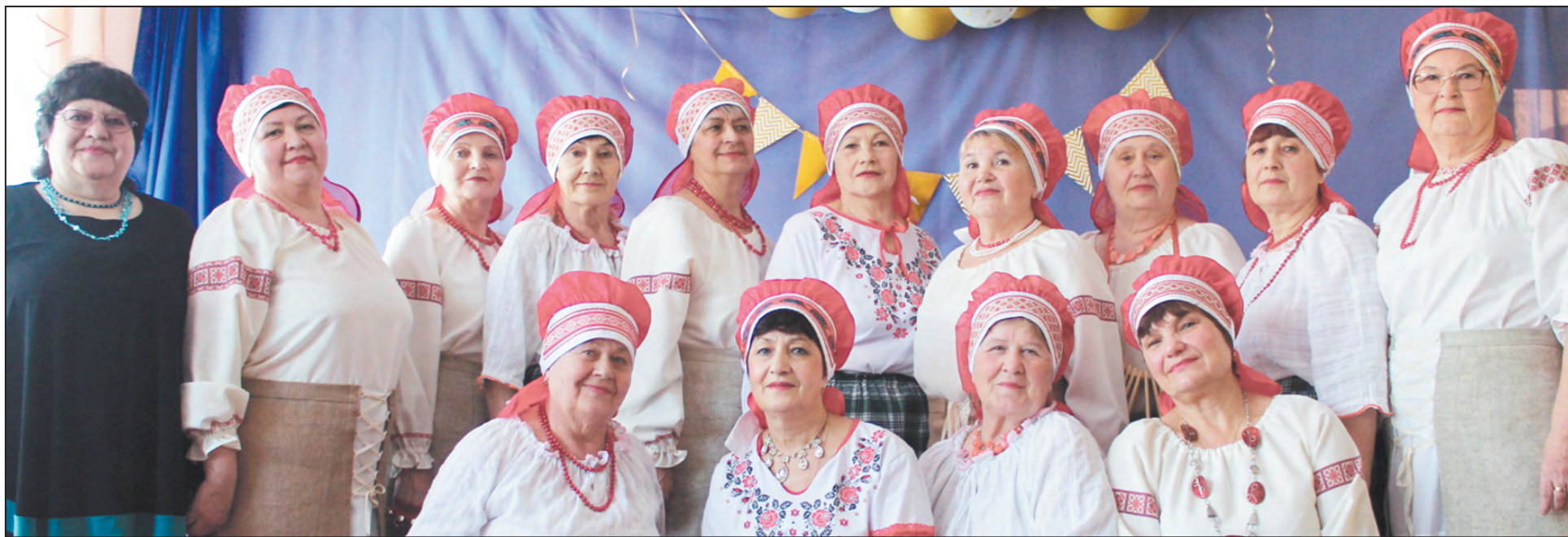
Клуб «Бодрость», п. Арти