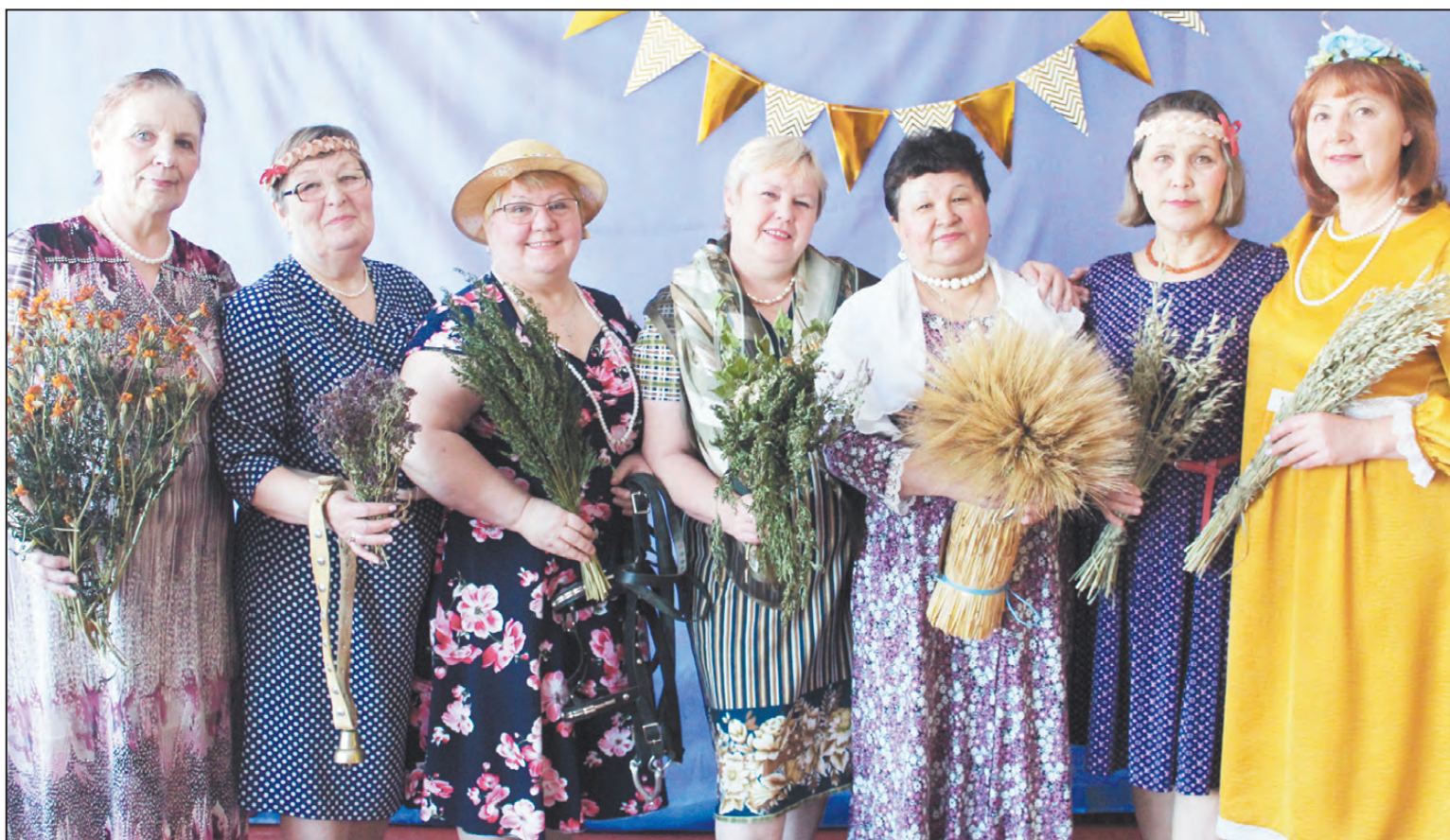
Клуб «Посиделки», с. Манчаж

Е. ГОЛЫХ, специалист ГАУСО СО «КЦСОН Артинского района», куратор клубного движения «Радуга»