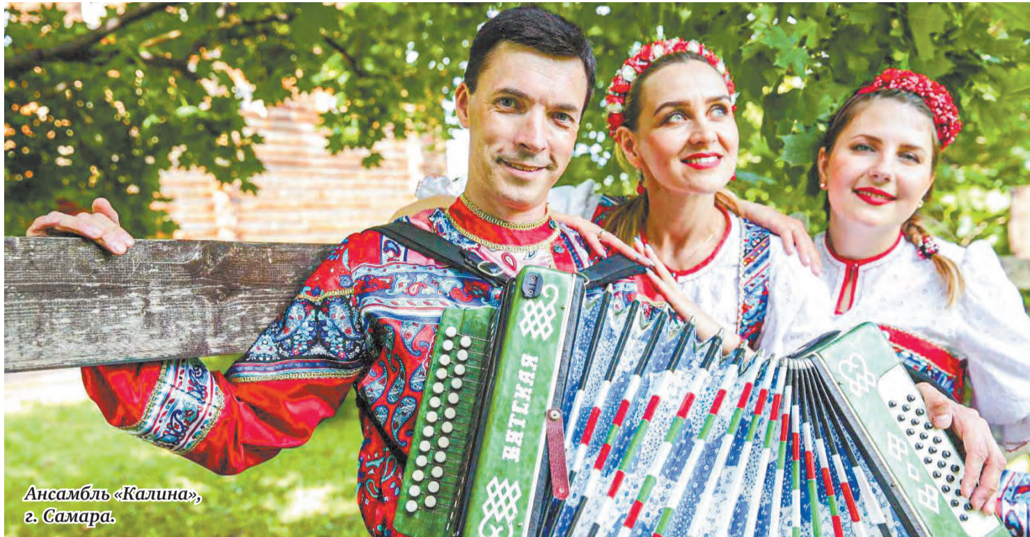
Ансамбль «Калина», г. Самара.

18 марта по всей России отмечался День баяна, аккордеона и гармонии.