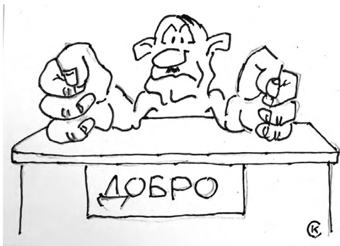
Более полувека жизнь художника делится на две части: одна—реальность простого работника, другая—искрометный мир карикатуры.

—Карикатура всегда была интересным объектом для изучения, и относились к ней неоднозначно. В Англии издано семь томов, посвященных английской карикатуре. У нас пока нет ни одной серьезной книги, исследующей этот жанр. Безумно интересно находить информацию о том, как развивалась карикатура, на каких принципах она строится. Задача музея—поделиться смыслом и магией карикатуры с посетителями, — поясняет Смагин.