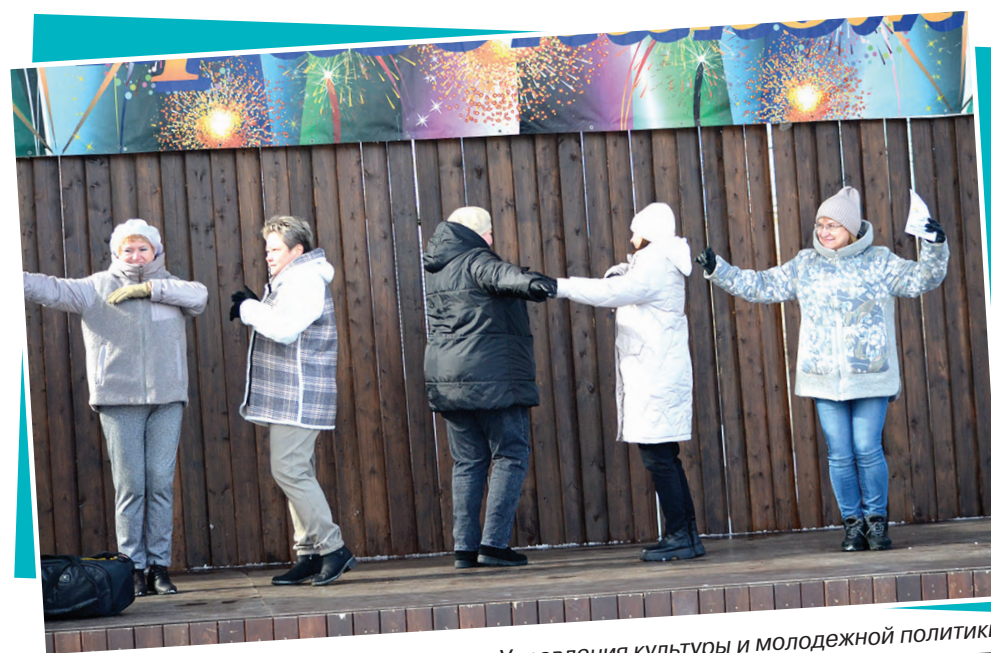
Команда Управления культуры и молодежной политики

Когда начинают говорить о работниках культуры, то сразу вспоминаются красочные веселые мероприятия, концерты, фестивали, различные торжественные