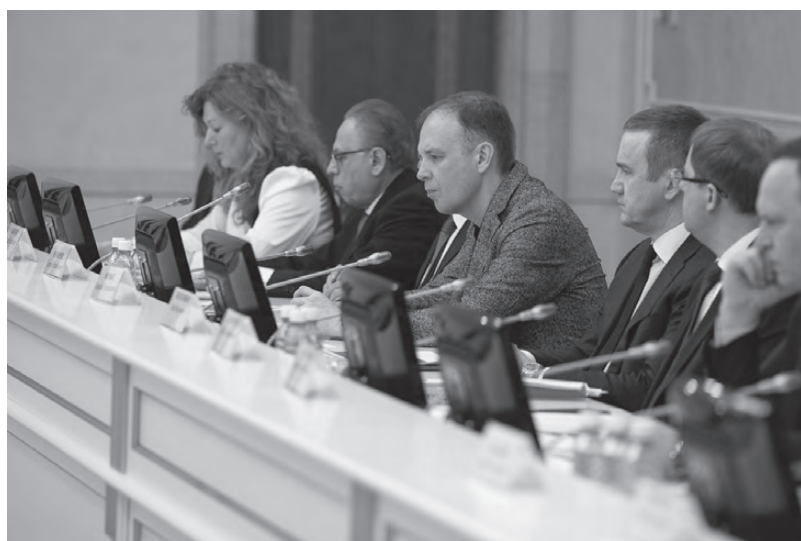
Заседание попечительского совета

– Также уже ведется разработка специальной цифровой платформы для участников «Кампуса» – будет и сайт, и мобильное приложение. И мы не планируем ограничиваться лишь перечисленными программами. Деятельность фонда «Кампус» будет расширяться. Следующим шагом могут стать дополнительные меры поддержки преподавателей. В конечном итоге реализация проекта «Кампус» должна дать комплексный эффект: сформировать в регионе сильное студенческое сообщество, создать достойные условия для педагогов, подготовить квалифицированных и востребованных специалистов, которые будут способствовать дальнейшему развитию Сверд-