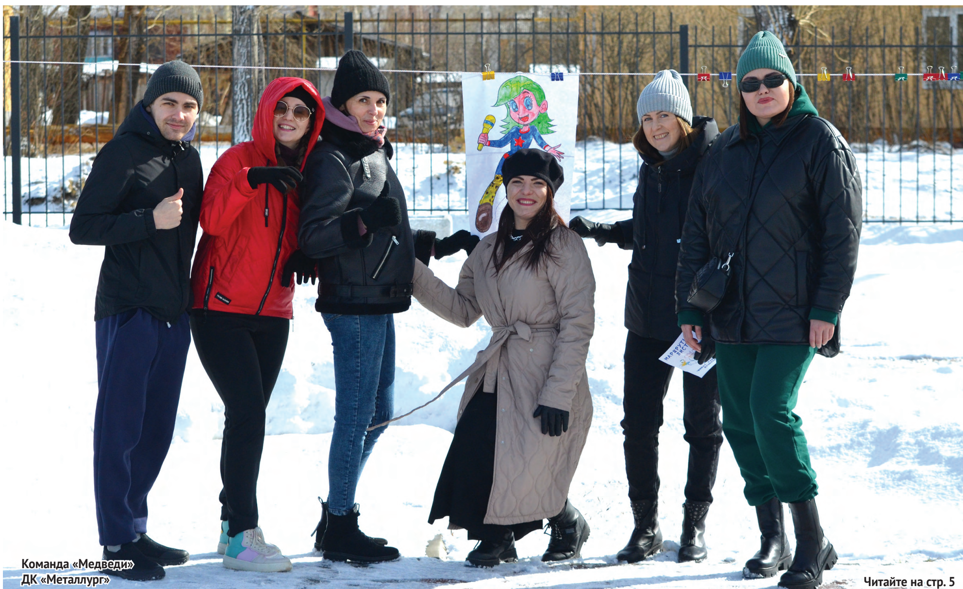
Команда «Медведи» ДК «Металлург»