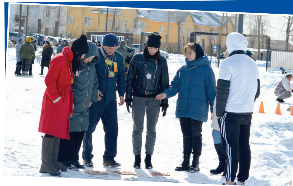
Команда ДК «Химик»

библиотекари и другие творческие работники. Представители этих профессий обладают тонким чувством прекрасного, во всем ищут вдохновение, креативно мыслят, поэтому и свой праздник они решили отметить необычным образом. Сотрудники городских учреждений культуры, объединившись в команды, приняли участие в творческом квесте «Виват, работники культуры!», организованном для них центром по работе с молодежью «Молодежная галактика».