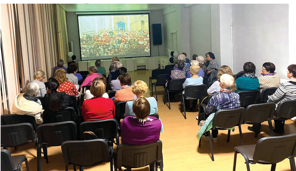
Трансляция концерта из филармонии Екатеринбурга