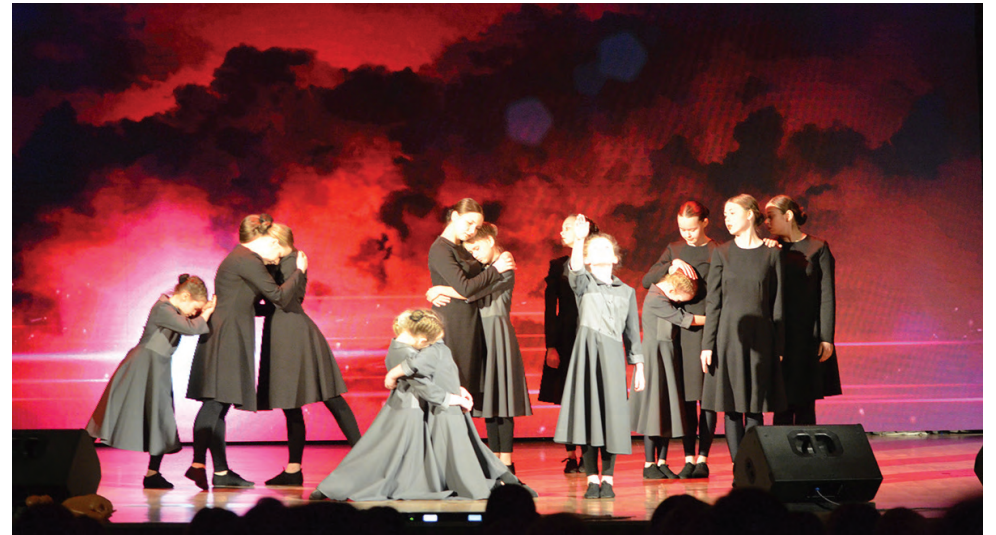
Танцевальный коллектив «Марион» с танцем «Война»

пломы лауреатов 1-й степени в разных возрастных группах получили: