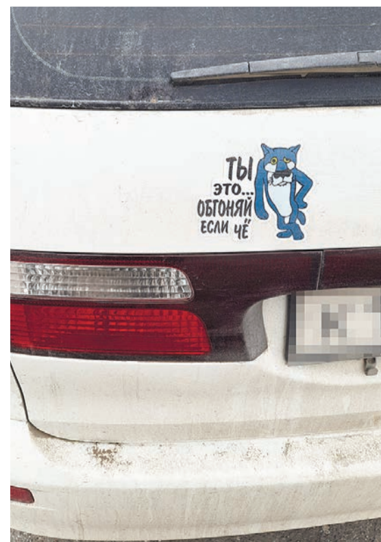
Готов уступить дорогу