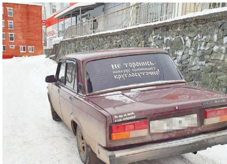
Любитель давать советы. «Не торопись – наверху принимают круглосуточно!», Не едь за мной, я сам потерялся!»