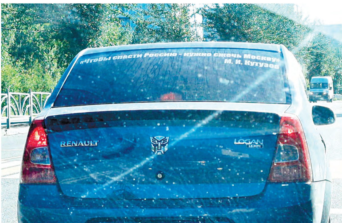
«Чтобы спасти Россию, нужно сжечь Москву» – цитата М. Кутузова