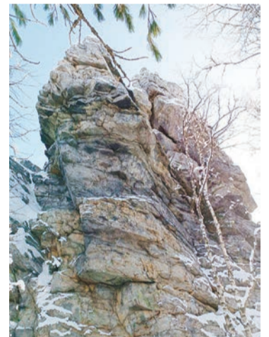
Каждая гора на Урале причудлива по своему

Скала Кораблик находится на вершине горы Синяя, это одна из самых высоких точек хребта Синие горы. Расположен этот хребет возле границы Европы и Азии, в непосредственной близости от поселка Синегорский. Будучи геоморфологическим и ландшафтным памятником природы, скала интересна и своим историческим значением. Историки утверждают, что близ этих мест проходило войско Ермака, отправившееся на