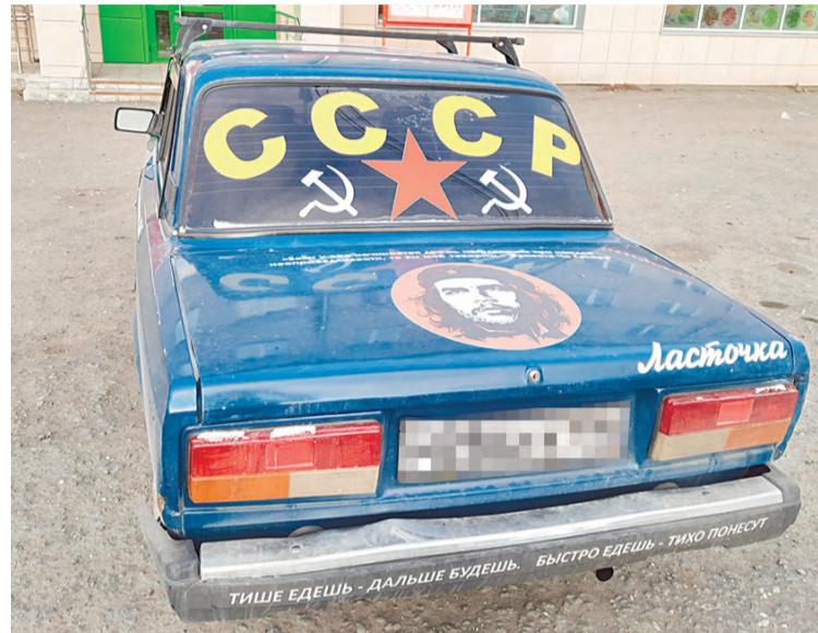
Назад в прошлое