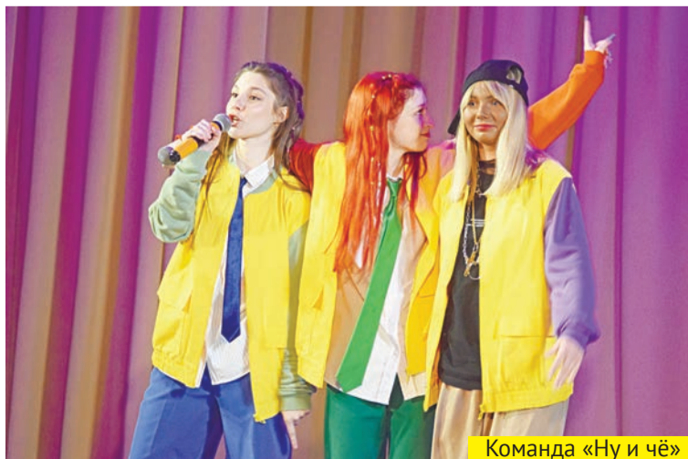
Команда «Ну и чё»