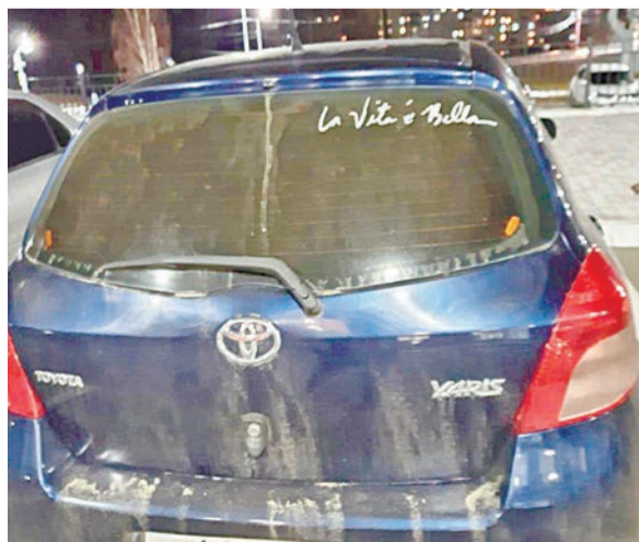
la vita e bella (с итальянского – «жизнь прекрасна»)