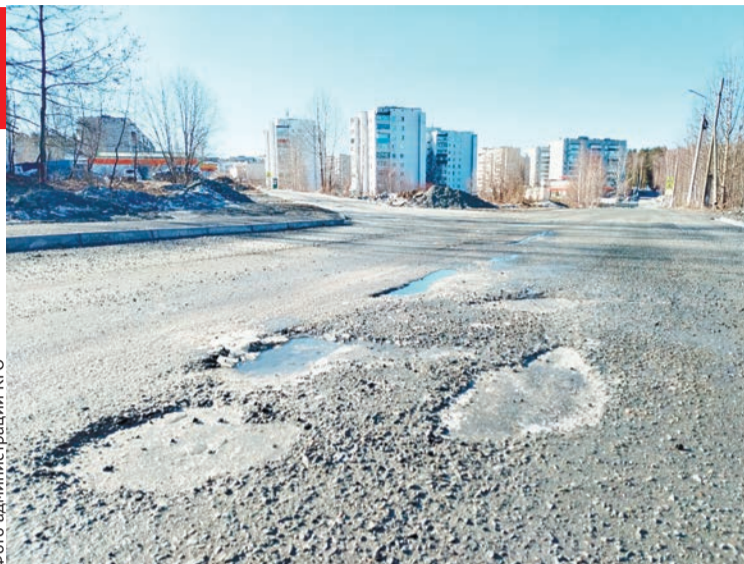
Дорогу по улице Тагильской ремонтировали осенью прошлого года

По улице Жилой и троллейбусному кольцу основные дефекты связаны с примыканием улицы к проезду к дому 10-61 и к дороге в сторону «Орлёнка». Выявлено незначительное разрушение асфальта на кольце.