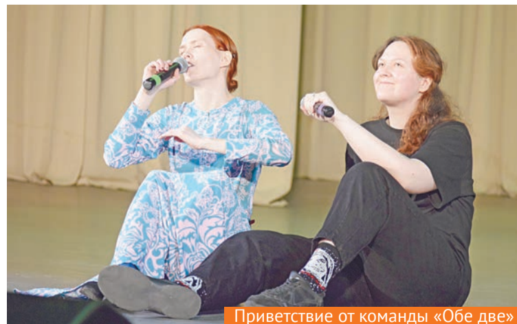
Приветствие от команды «Обе две»