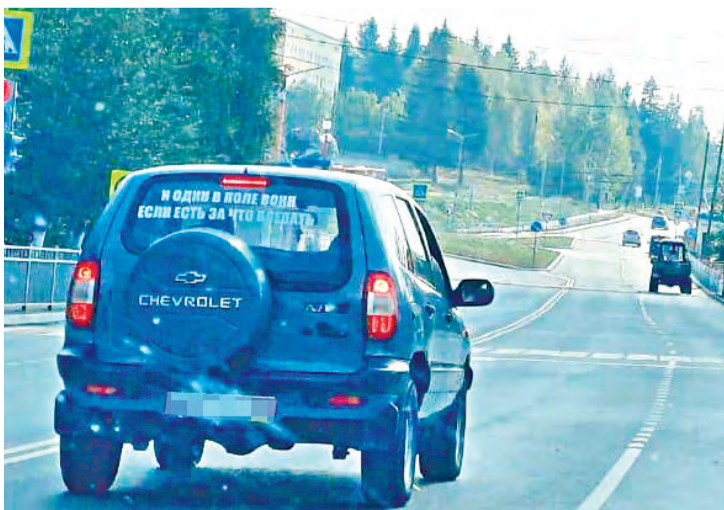
«И один в поле воин, если есть за что воевать»