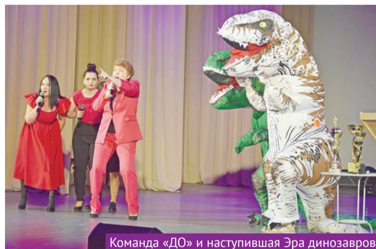
Команда «ДО» и наступившая Эра динозавров