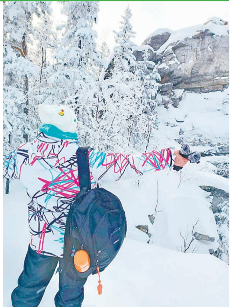
Гора Синяя — самая высокая точка хребта

Вдалеке виднеется большое поле и едва заметный след снегохода: то ли у туристов просто покатушки по лесу были, то ли тропа приведет нас к первой цели нашего маршрута. Солнце светит не по февральскому тепло и ярко, за разговорами подходим к первому повороту. Впереди еще дорога, мы опять в замешательстве. О, чудо — ленточка на дере-