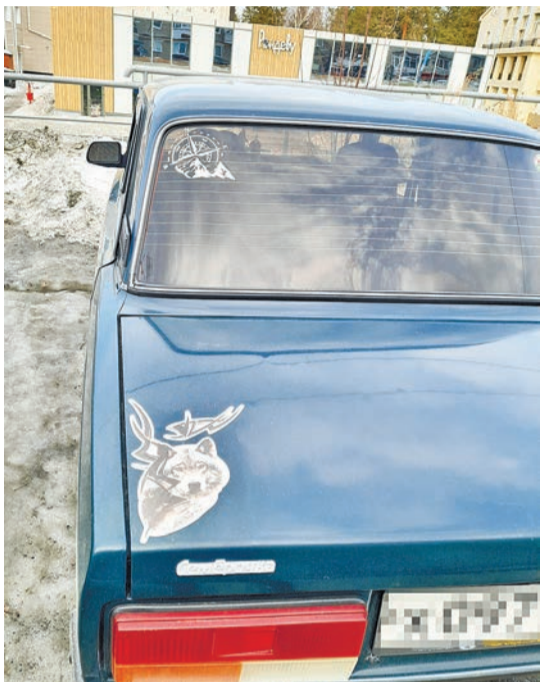
Любитель природы (или охотник?)