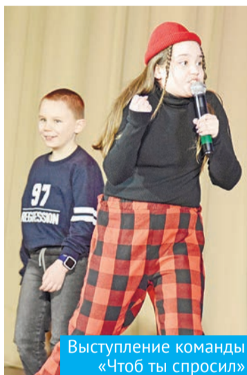
Выступление команды «Чтоб ты спросил»