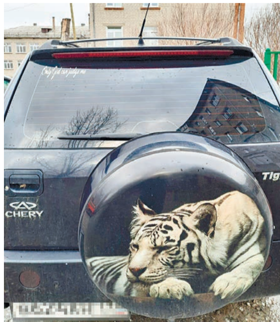
only God can judge me (с английского – «только бог может меня судить»)