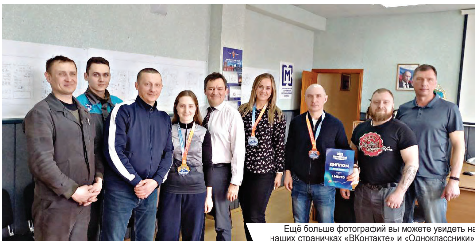
Ещё больше фотографий вы можете увидеть на наших страничках «ВКонтакте» и «Одноклассники».

Затем очередную золотую медаль в копилку нашей сборной принесла вновь