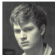
СТС • 21.00 «Мальш на драйве» (16+)