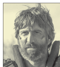
СТС • 21.00 «Элизиум» (16+)