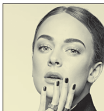
СТС • 23.00 «Лёд» (16+)