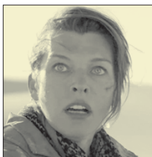
СТС • 21.00 «Охотник на монстров» (16+)