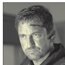
СТС • 21.00 «Падение Олимпа» (16+)