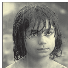
СТС • 21.00 «Книга джунглей» (0+)