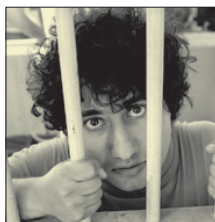
СТС • 01.00 «Ставка на любовь» (12+)