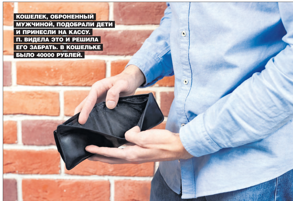
КОШЕЛЕК, ОБРОНЕННЫЙ МУЖЧИНОЙ, ПОДОБРАЛИ ДЕТИ И ПРИНЕСЛИ НА КАССУ. П. ВИДЕЛА ЭТО И РЕШИЛА ЕГО ЗАБРАТЬ. В КОШЕЛЬКЕ БЫЛО 40000 РУБЛЕЙ.

Благодаря камерам видеонаблюдения, подозреваемую нашли. П. вернула всю