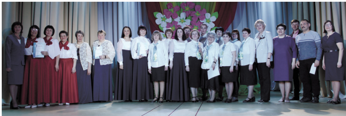
Дипломанты и лауреаты фестиваля.