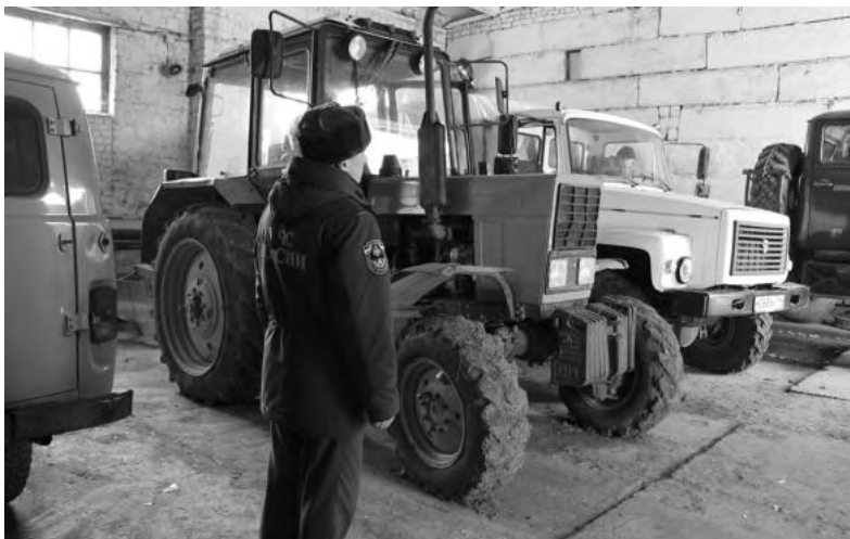
Техника Ирбитского участка уральской авиабазы.

- У нас все готово. Техника основная тоже готова. В арсенале