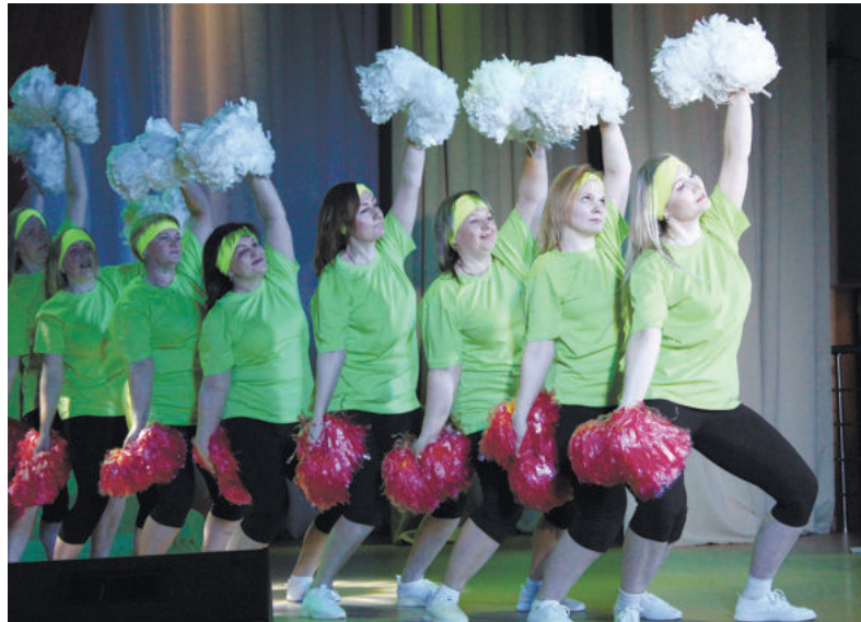
«Вдох глубокий, руки шире...» Воспитатели Зайковского детского сада №1 провели зарядку.

- Наши учителя во многом уникальные люди. Они многое могут, в том числе и показать свои творческие способности. Наверное, только такие та-