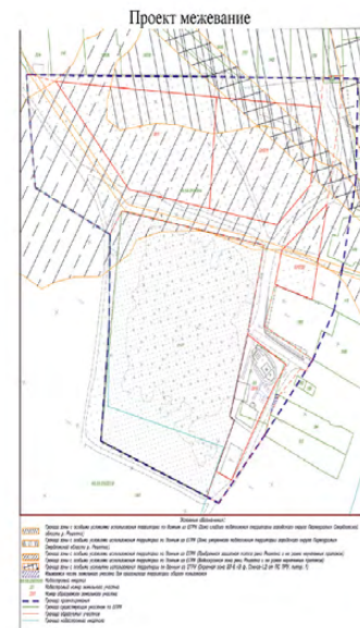
Приложение 2 к проекту планировки и межевания территории