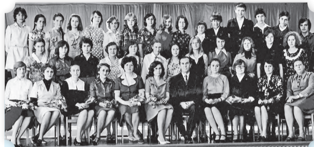
Первый выпуск ДМШ