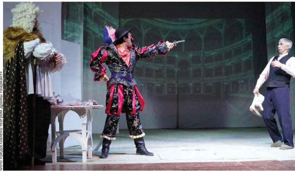
Классика на сцене «Варианта» — в новом прочтении

— Мы создаем спектакль для подростков и молодежи, поэтому приближаем чеховских героев к современности. Это приближение создается за счет смешения стилей и эпох в костюмах персонажей