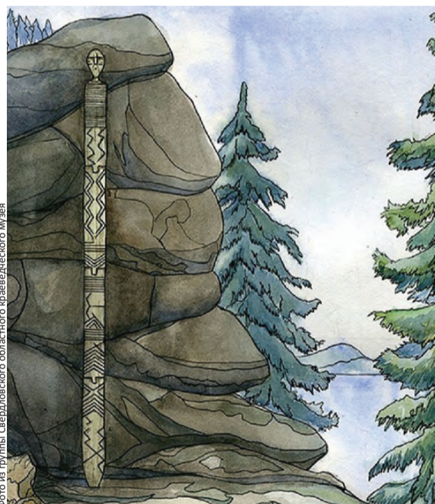
Где стоял идол, в лесу или на берегу, точно не знаем.

Только в 2003 году для идола сделали специальную витрину, в которой поддерживаются оптимальные условия: всегда постоянная температура — 16 градусов. Для минимизации силы тяжести, чтобы избежать разрушения и деформации фигуры, фрагменты идола прикрепили к витрине тонкими металлическими скобами так, чтобы давление было минимальным. Также ученые разработали специальную подсветку, подчеркивающую детали Шигирского идо-