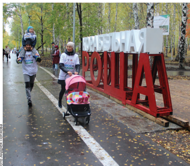
Обновленная роща стала излюбленным местом отдыха горожан