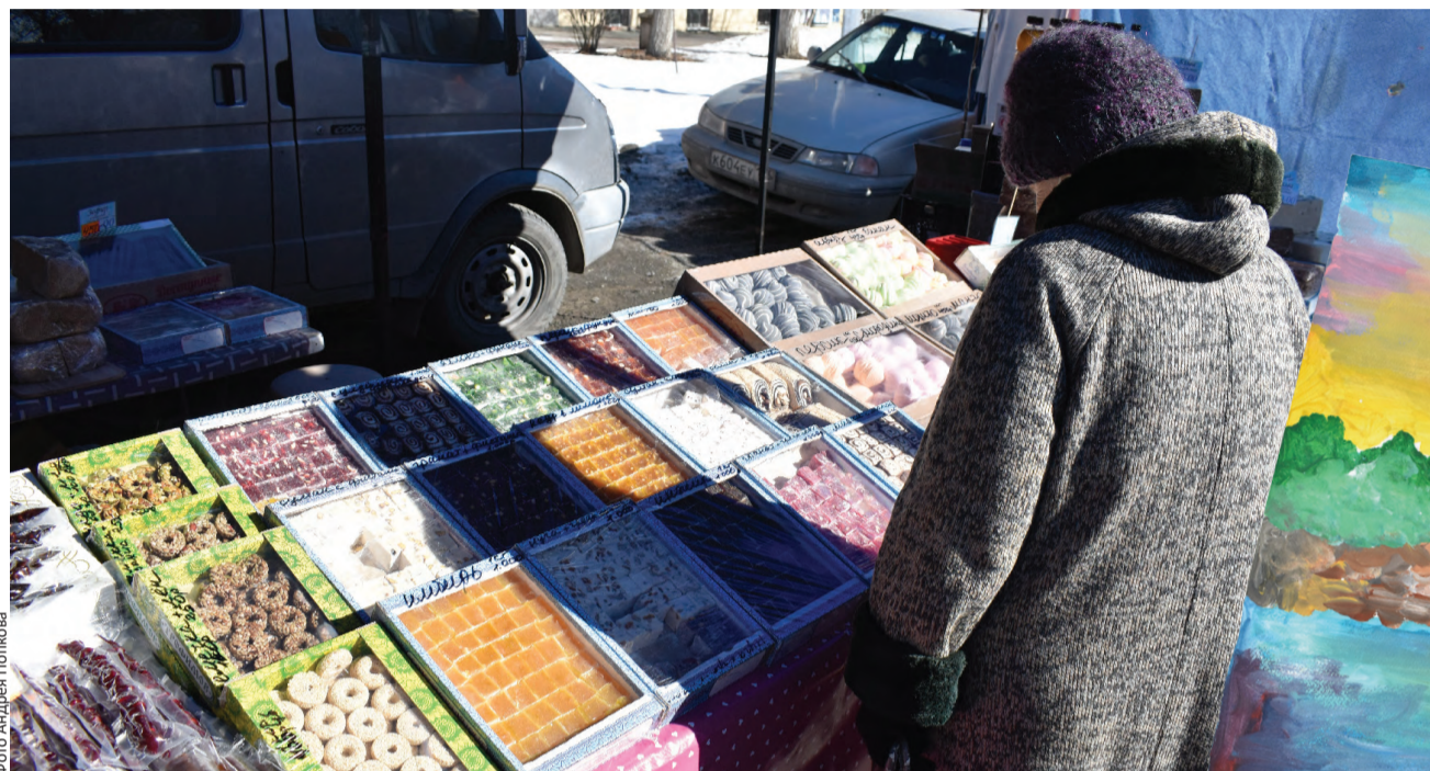
Хочется попробовать все!

Первоуральск отметил со всей страной девятую годовщину воссоединения Крыма с Россией. В рамках ярмарки выходного дня состоялся фестиваль крымской кухни. Не обошлось и без пищи духовной. Горожане получили возможность еще больше узнать о Крыме: как говорится, лучше один раз увидеть, а еще лучше – попробовать!