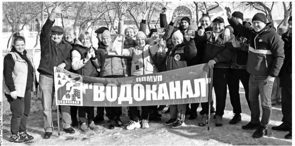
Команда-победитель спартакиады ЖКХ