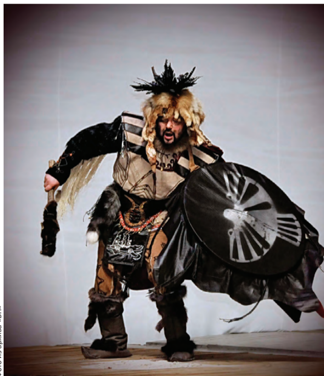
Шаман племени, создавшего истукана (по версии «Варианта»)