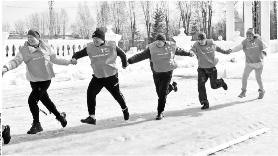
В прямом смысле слова командный забег

В Первоуральске по случаю профессионального праздника работников бытового обслуживания и жилищно-коммунального хозяйства прошла спартакиада ЖКХ. На старты и поболеть вышли сотрудники шести организаций: представители управления ЖКХ и строительства, ПМУП «ПО ЖКХ», работники управляющих компаний и ресурсоснабжающих организаций – более 150 человек.