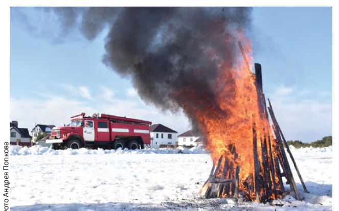
В учениях было задействовано более 200 человек и 54 единицы спецтехники