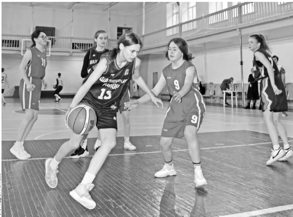
В атаке победитель – команда «Искра»

болу 3х3 им. К.Писклова» – турнир многоступенчатый: состоит из четырех этапов, где идет отбор самых перспективных и талантливых. Первый, внутришкольный, этап прошел осенью прошлого года непосредственно в общеобразовательных учреждениях, в рамках уроков физкультуры. Второй, муниципальный, – в феврале, уже на площадках ДЮСШ. Третий – дивизионный – собрал в спорткомплексе «Уральский трубник» шесть команд из четырех городских округов: Первоуральского, Ачитского, Ревдинского, и Шалинского.