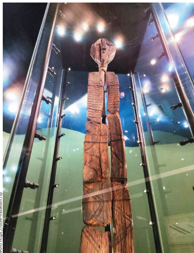
Главный обитатель Шигирской кладовой

По сути, создатели идола оставили послание, не расшифрованное до сих пор. А значит, открыли дорогу для прочтений.