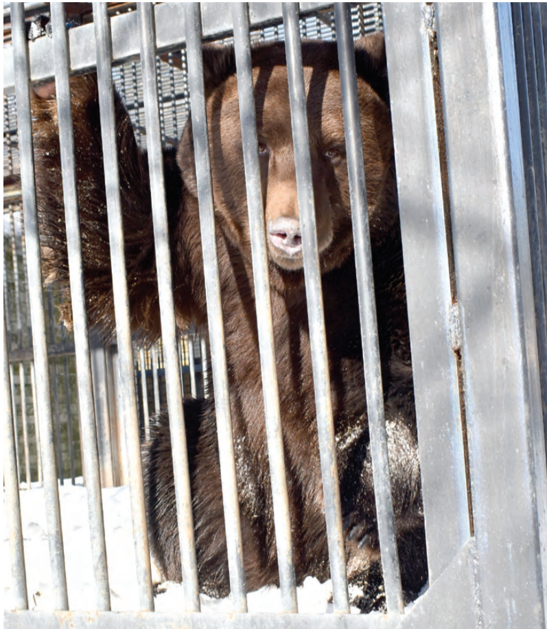
В этом году мишки проснулись на месяц раньше

Не успело как следует пригреть солнышко, мишки сразу отреагировали. Есть предположение, что, возможно, это был очередной выход на «сонную» трапезу, но бурые