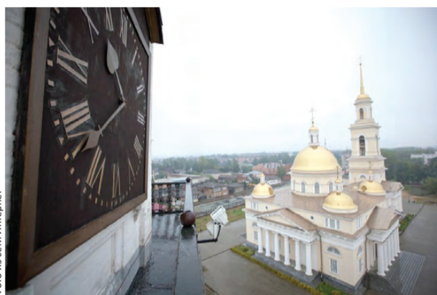
Сквозь время: такой вид открывается из наклонной башни Демидовых

Среди таких новаций – и реформа часа. До того на Руси считывали по отдельности. День начинался от восхода солнца, и начало дневных часов вели, соответственно, от него, а ночь «отмеряли» от захода солнца. Причем в зависимости от времени года количество дневных и ночных часов в сутках менялось. Самый длинный день в году и самая долгая ночь (соответственно летом и зимой) длились по 17 часов.