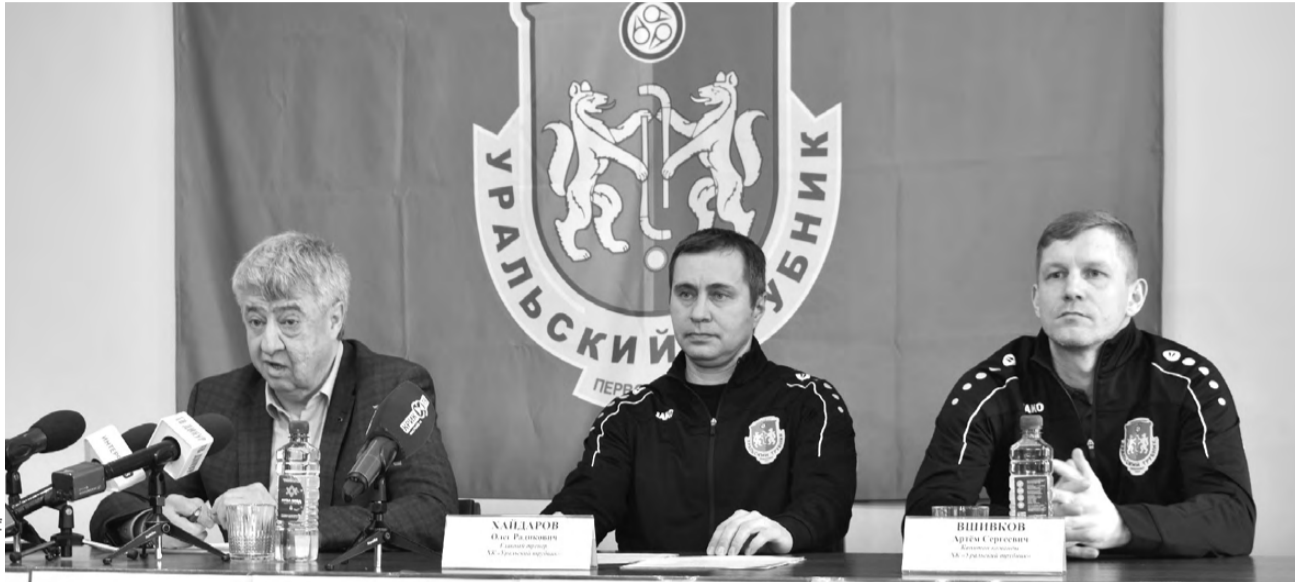
Руководство ХК «Уральский трубник» надеется, что следующий сезон будет другим