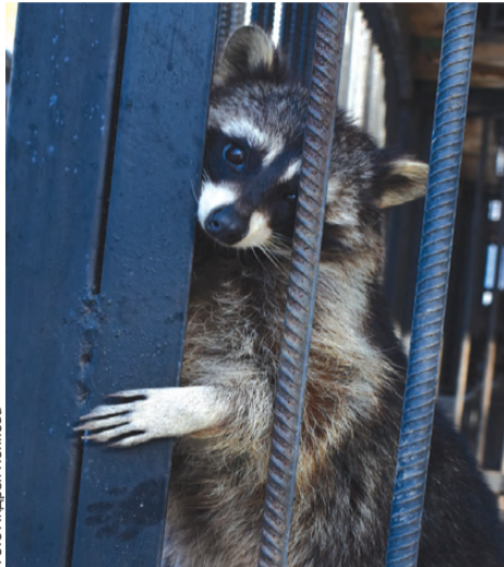
Скоро все обитатели переедут в новые вольеры