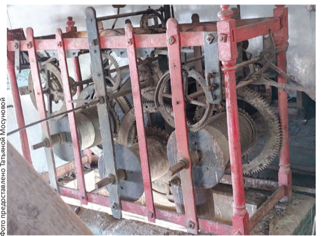
Быньги. Вот оно, механическое сердце

Заводятся куранты один раз в сутки вручную.