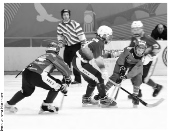
Наша сборная уступила в стартовом матче, но надежды на победу не теряет