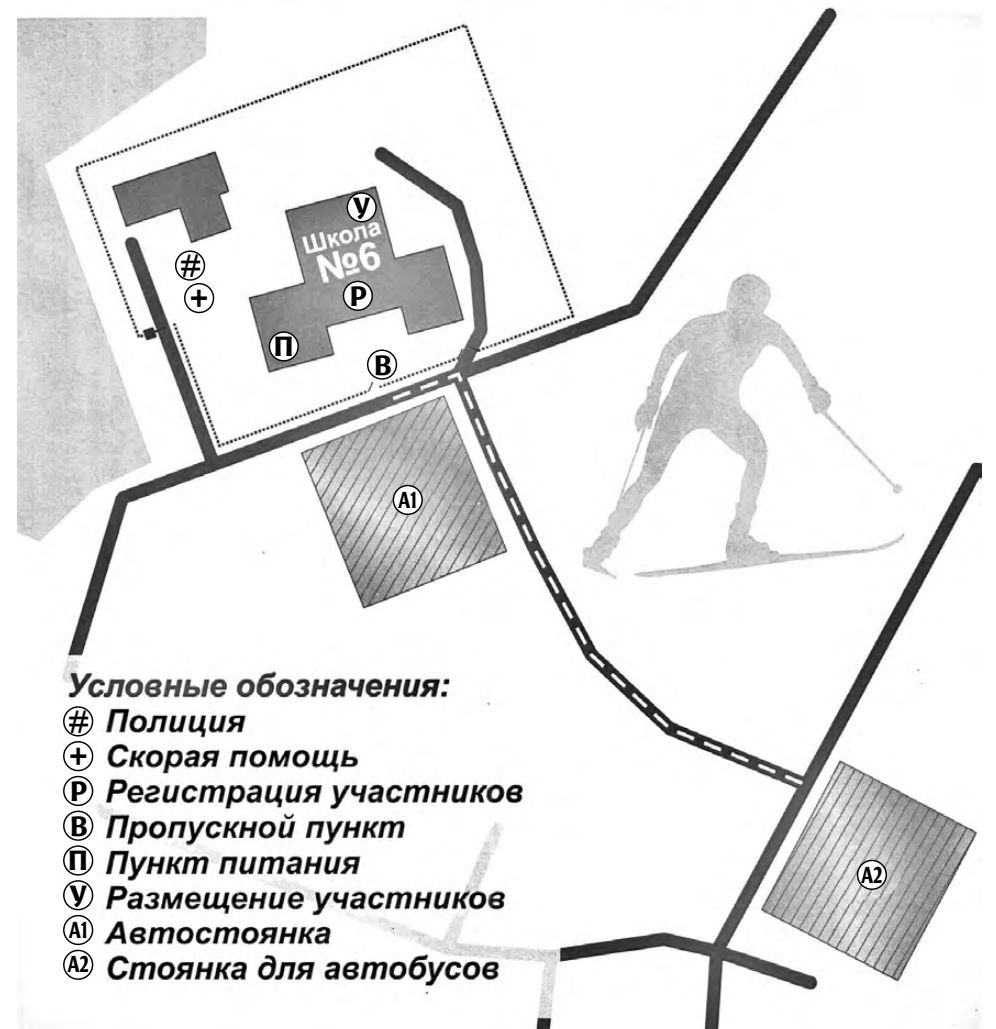
СХЕМА места проведения Всероссийской массовой лыжной гонки «Лыжня России» в городском округе Сухой Лог

Приложение №2 к постановлению Администрации городского округа Сухой Лог от 03.02.2023 №171-ПА