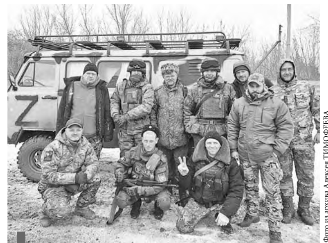
Один из автомобилей передан добровольцам из отряда «Барс-15»