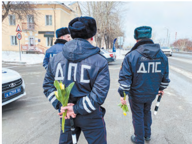
Сотрудники полиции в рамках ежегодной акции «8 Марта – в каждый Дом» поздравили женщин с наступающим праздником – Международным женским днём

Все участницы акции были приятно удивлены и тепло отнеслись к общению с сотрудниками полиции, пообещав всегда быть примерными участниками дорожного движения.