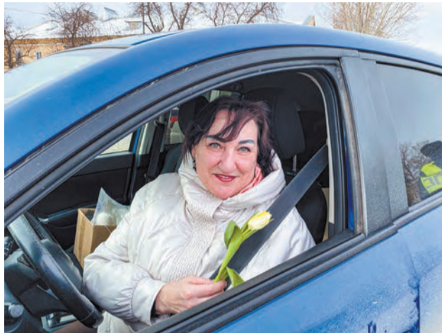
ГИБДД г. Ирбита.