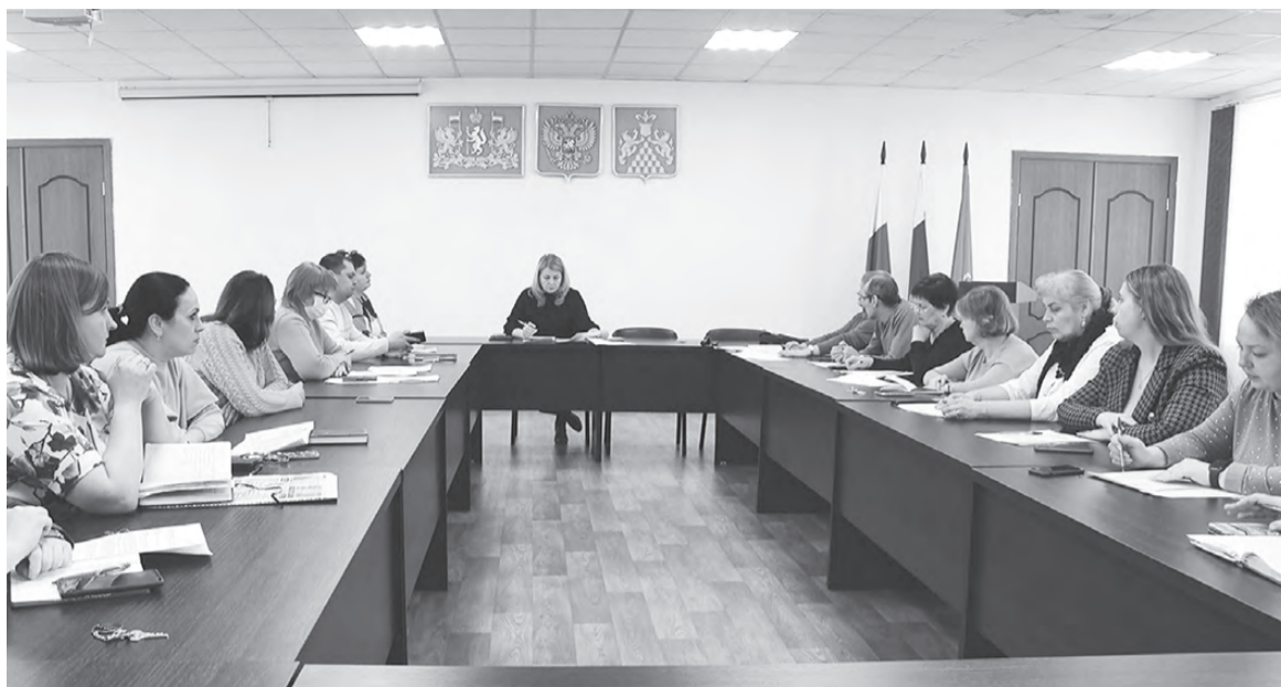
Заседание межведомственной комиссии

По словам медиков, по-прежнему на территории нашего города прогрессирует и ВИЧ-инфекция. Согласно статистике, в 2022 году на ВИЧ было обследовано 5077 человек, из них вновь выявлено с этим заболеванием 48 человек. Умерло в прошлом году 28 ВИЧ-инфицированных, в