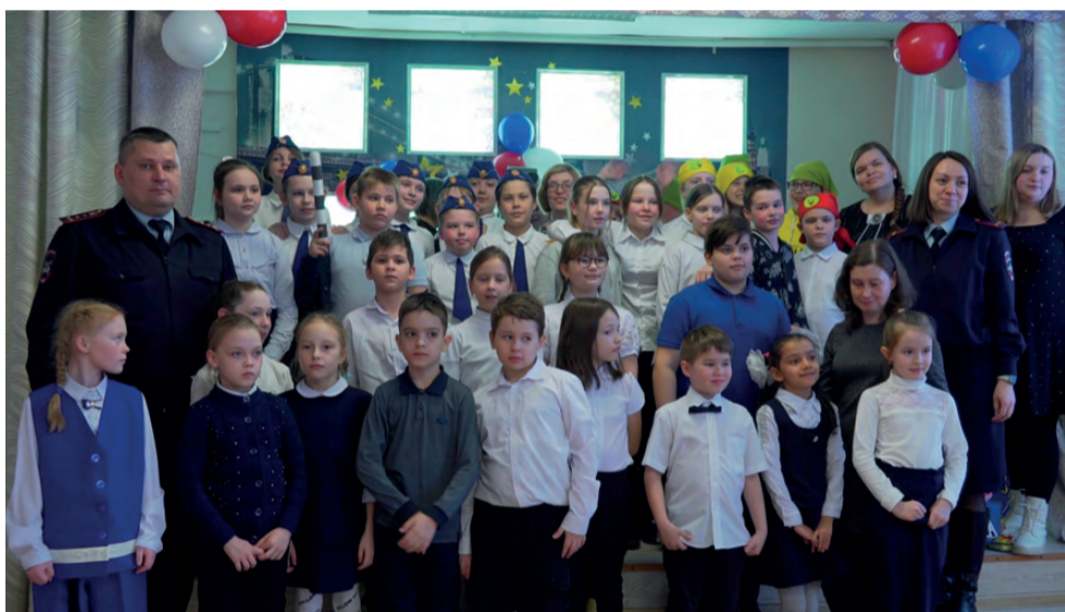
Общее фото на память