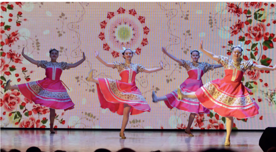
Танцевальный коллектив «Марион»