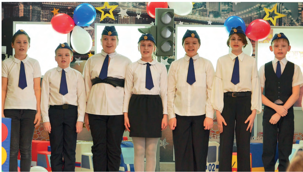
Выступление отряда ЮИД

– В первую очередь, ребята, я хочу поблагодарить наших педагогов за то, что они занимаются с вами, преподносят вам