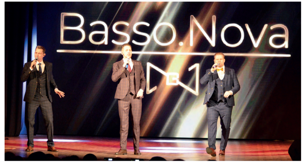
Трио басов «Basso.Nova»