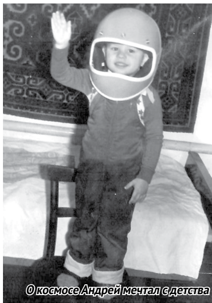
© космосе Андрей мечтал с детства