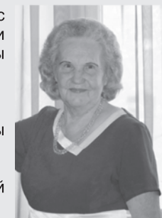
Родные и близкие.

Ты всегда мысленно рядом, Вечная память, вечный покой. Помним, любим, скорбим =