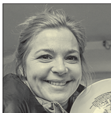
СТС • 19.00 «Моя мама — шпион» (16+)