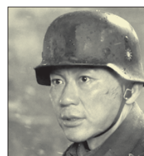
СТС • 23.20 «Восемь сотен» (18+)