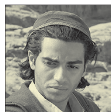
СТС • 20.45 «Аладдин» (0+)