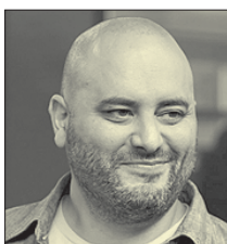
СТС • 22.30 «Стоп-кран» (12+)