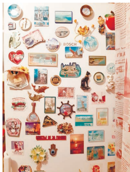
Магниты. Рая Коротких