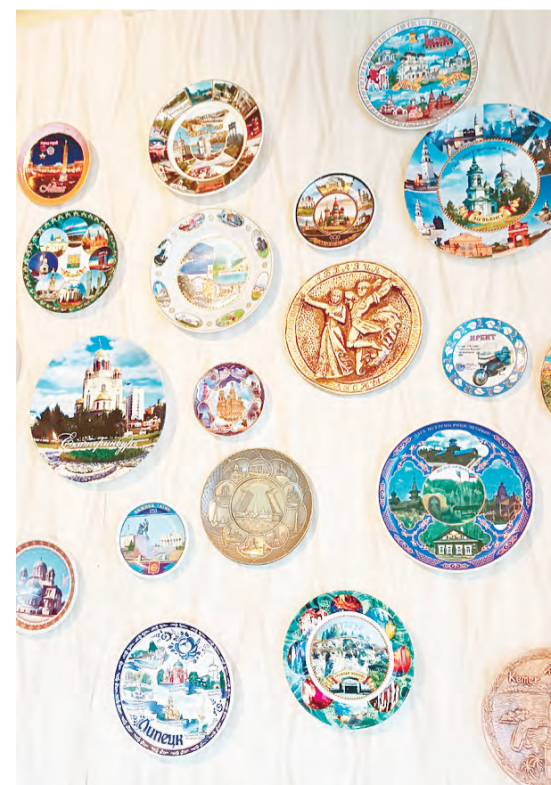
Тарелки из разных городов. Наталья Гришина