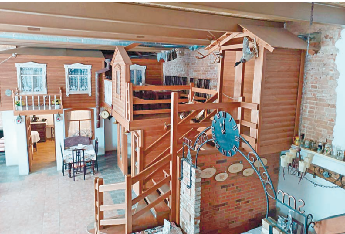
Единственный в России Музей пельменя

замешивали тесто. Мужчины в небольшом корыте с помощью сечки рубили мясо для начинки. Дети помогали стряпать. Эта традиция перешла в советское время, когда вся семья собиралась вместе, чтобы налепить несколько сотен пельменей за раз. Не забывали и про счастливую начинку — в один пельмень могли спрятать карамельку или что-нибудь другое. Считалось, что этот сюрприз принесет удачу.