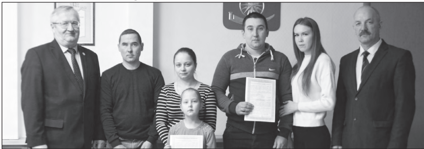
— За свидетельством - всей семьей.

Поддержка государством семьи – это и поддержка села