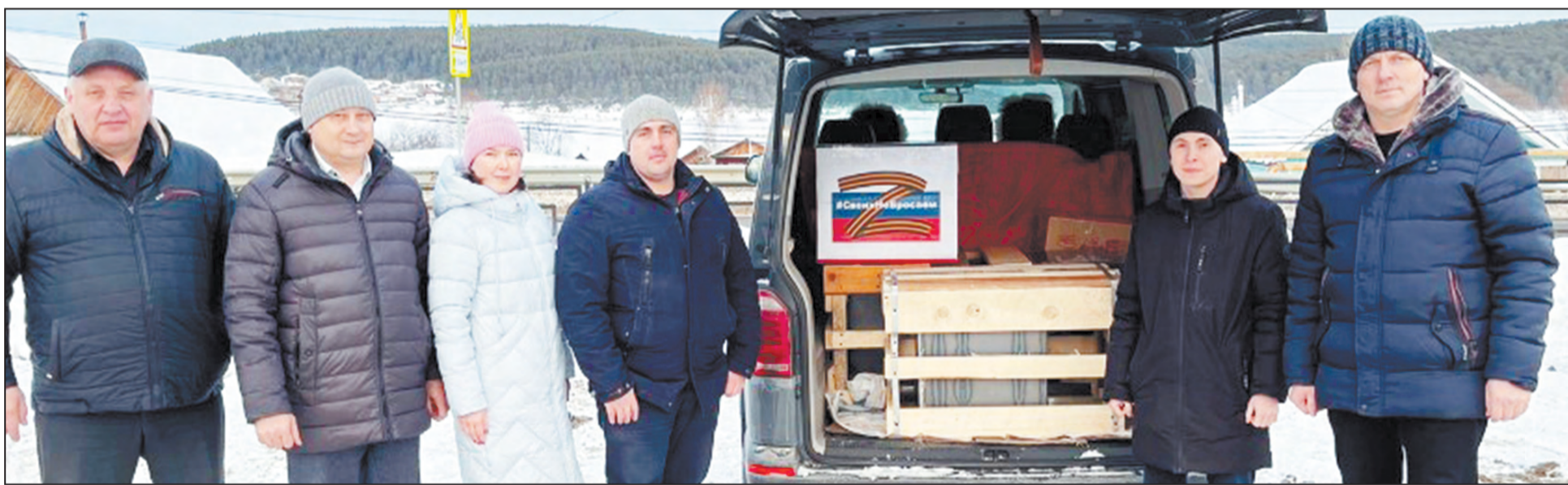
Груз от трех районов - Артинского, Красноуфимского и Ачитского - собран