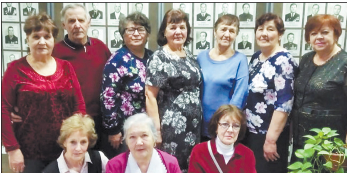
Заводчане у стенда

Во имя памяти ушедших, во имя совести ЖИВЫХ Артинцы тоже внесли свой вклад в победу под Сталинградом