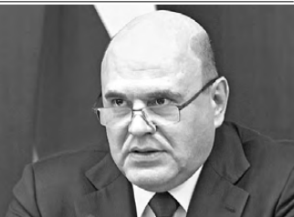
Михаил Мишустин, председатель правительства РФ:

—Почтовые отделения особенно востребованы в самых дальних районах, где альтернативы государственному оператору просто нет. Помимо посылок многим людям через почту доставляется пенсия, социальные пособия. Такие услуги должны оказываться в хороших условиях. Нужно привести почту в нормальное состояние, чтобы была новая мебель и оборудование, а сами отделения стали современными и удобными.