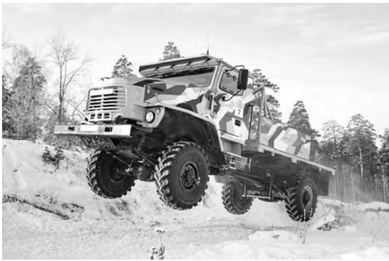
Южноуральский автомобиль дал фору некоторым грузовикам, специально доработанным для гонок.

Команда автозавода «Урал» заняла второе место в федеральных гонках на Кубке «Лебедушкино озеро» в Твери. В этом году соревнования «Триал для грузовиков» прошли во второй раз. Соперниками уральцев стали восемь автомобилей разных производителей, причем серийными оказались только «Урал» и КамАЗ. Остальные машины были существенно доработаны специально для соревнований. Команду из Миасса опередили спортсмены из Московской области на ЗиЛе, КамАЗ стал третьим.