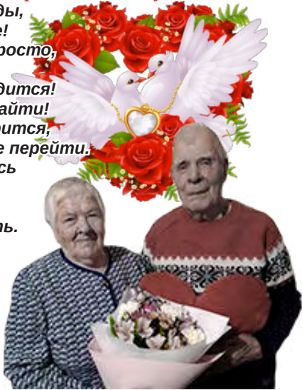
С любовью дети, внуки, правнуки

Ваш брак благословили звезды, Вам дав согласие и терпенье! Ваш подвиг повторить не просто, Он вызывает восхищенье! По праву вами вся родня гордится! Прекрасней пары в мире не найти! Недаром ведь в народе говорят, Что жизнь прожить - не поле перейти: Хоть морщинки лиц коснулись И давно седеет прядь, Вы прекрасны, как и прежде, Вместе вы шестьдесят пять. Восхищаемся любовью, Что сквозь годы пронесли, Пожелаем вам здоровья, В счастье чтобы дни текли. Радуют пускай вас внуки, Правнуки кружат вокруг. Никогда не отпускайте Своих нежных, верных рук.