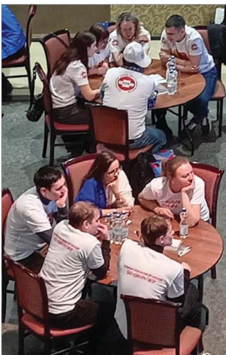
Команда «3+2» - дебютант «Мозголомки».

18 февраля 27 команд горняков и металлургов со всей Свердловской области, и не только – были участники из Тюмени, приехали в Нижний Тагил на «Профсоюзную Мозголомку».