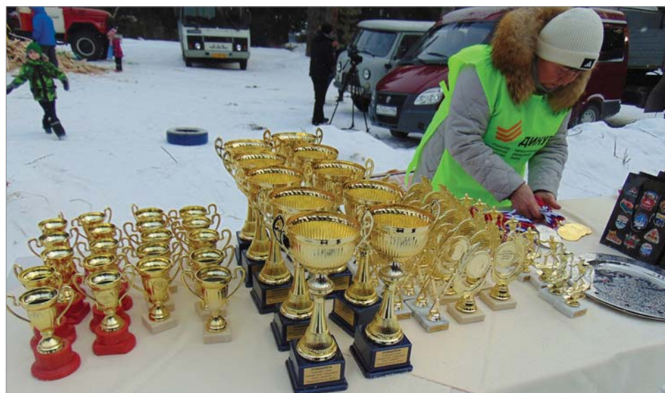
Награды ждут своих обладателей.

Соревнования были организованы с учётом разных возрастных категорий участников. Лыжни были