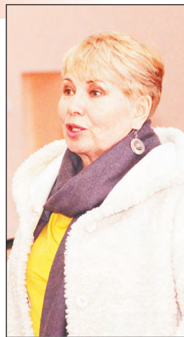
У меня вопрос!