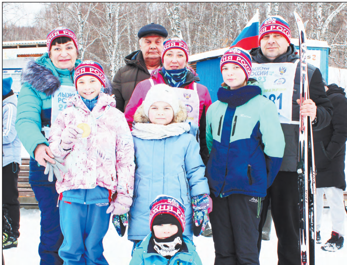
Шубины - самая спортивная семья

Можно бесконечно наблюдать за играющими котятками, терпеть за ухо маленьких щенят и наблюдать за соревнующимися детьми. Первыми старт приняли дошколята под предводительством медведя Миши, и началась борьба детей самих с собой. Трудно, имея один год возраста, теплый комбинезон и, вероятно, памперс внутри него, преодолеть бесконечные 400 метров дистанции. Дети пытались упасть вперед и чаще назад, но рядом были мамы и папы. Дистанцию закончили все юные участники. Тем более, что на них смотрели столько взрослых людей. Первый для некоторых детей выход на соревнования закончился полным успехом у зрителей. Самой юной участницей лыжного праздника в этот день стала