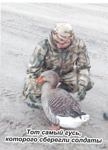
Тот самый гусь, которого сберегли солдаты

- Спокойно. Партия сказала — надо! Комсомол от-