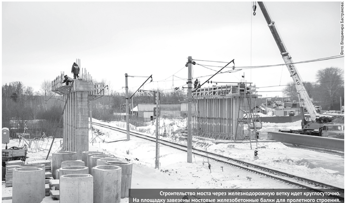
Строительство моста через железнодорожную ветку идет круглосуточно. На площадку завезены мостовые железобетонные балки для пролетного строения.

На территории ГО Богданович 418 км дорог местного значения, из них 160 км - дороги переходного