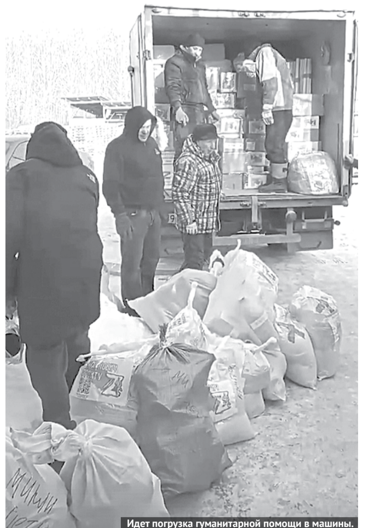
Идет погрузка гуманитарной помощи в машины.