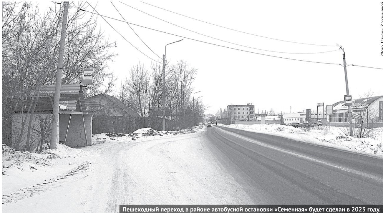
Пешеходный переход в районе автобусной остановки «Семенная» будет сделан в 2023 году.

- Пока вопрос открыт. Гидротехническое сооружение на реке Кунаре ниже по течению от моста на улице Степана Разина, так называемая Аверинская