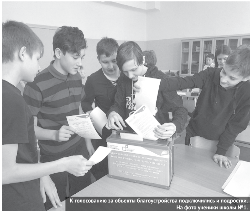
К голосованию за объекты благоустройства подключились и подростки. На фото ученики школы №1.

Члены общественной комиссии по реализации муниципальной программы «Формирование современной городской среды на территории городского округа Богданович на 2018-2027 годы» подвели итоги голосования по выбору общественной территории для участия во всероссийском конкурсе лучших проектов создания комфортной городской среды