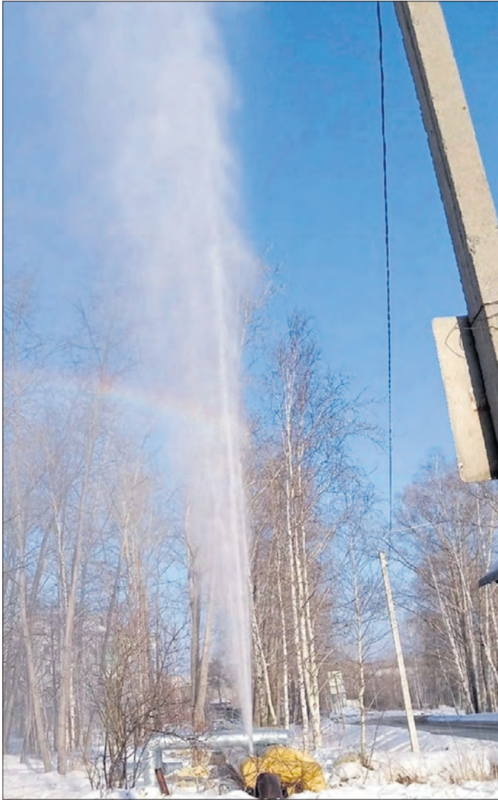
Скриншот видео в паблике «Инцидент | Первоуральск» в VK