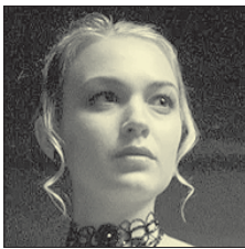
СТС • 00.55 «Другой мир» (18+)