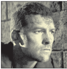
СТС • 20.00