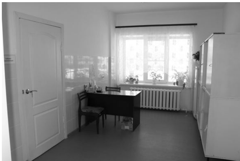
В Ницинском ФАПе капремонт сделан в 2021 году.