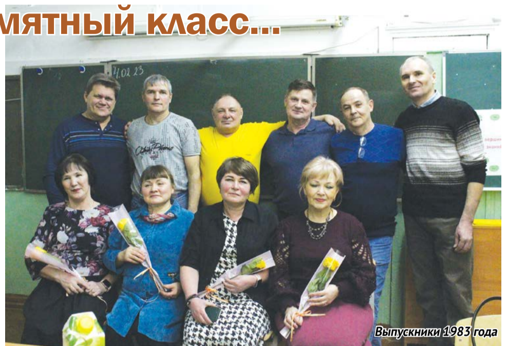
Выпускники 1983 года

Завершающим аккордом праздника стало выступление нынешнего педагогического состава школы, который за послед-