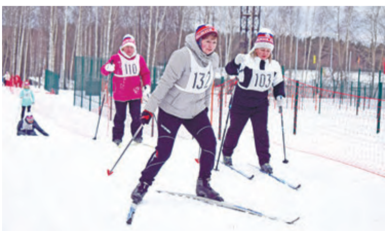
Сотрудники организаций показали отличную подготовку