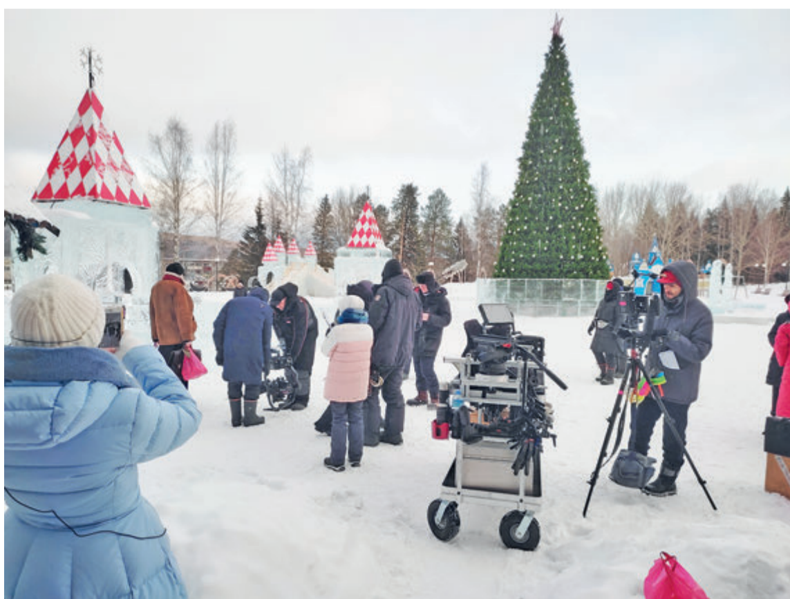
Съёмочный процесс возле ДК