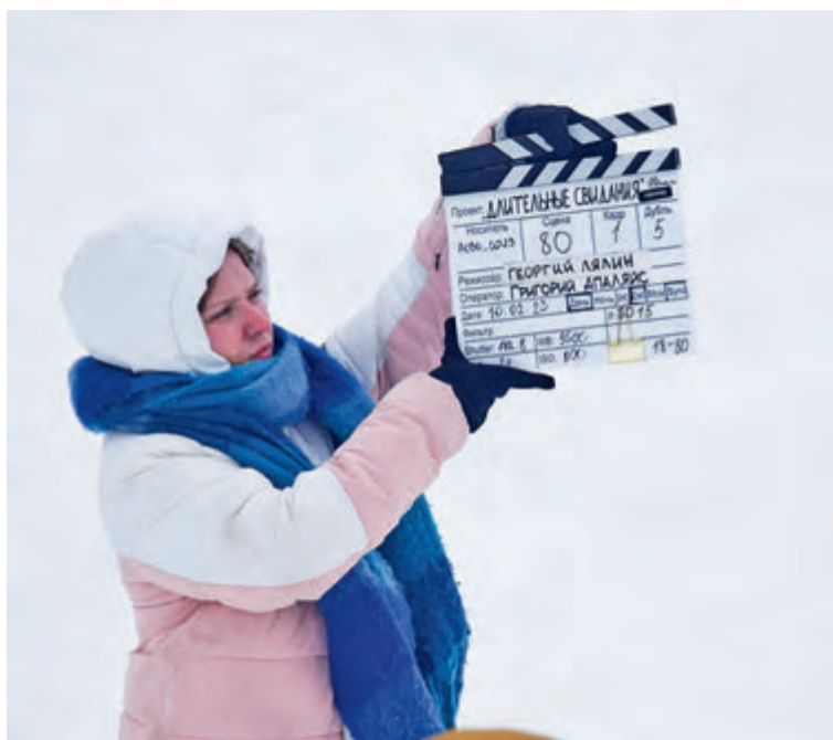
Было сделано немало дублей

символический пласт. Мы, конечно, после средней полосы, где все ровно и плоско, под большим впечатлением, — рассказал в одном из интервью режиссёр фильма Георгий Лялин .