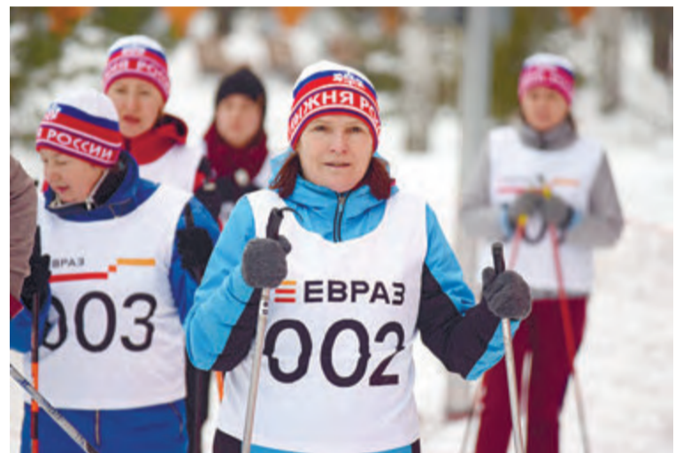
В ожидании старта