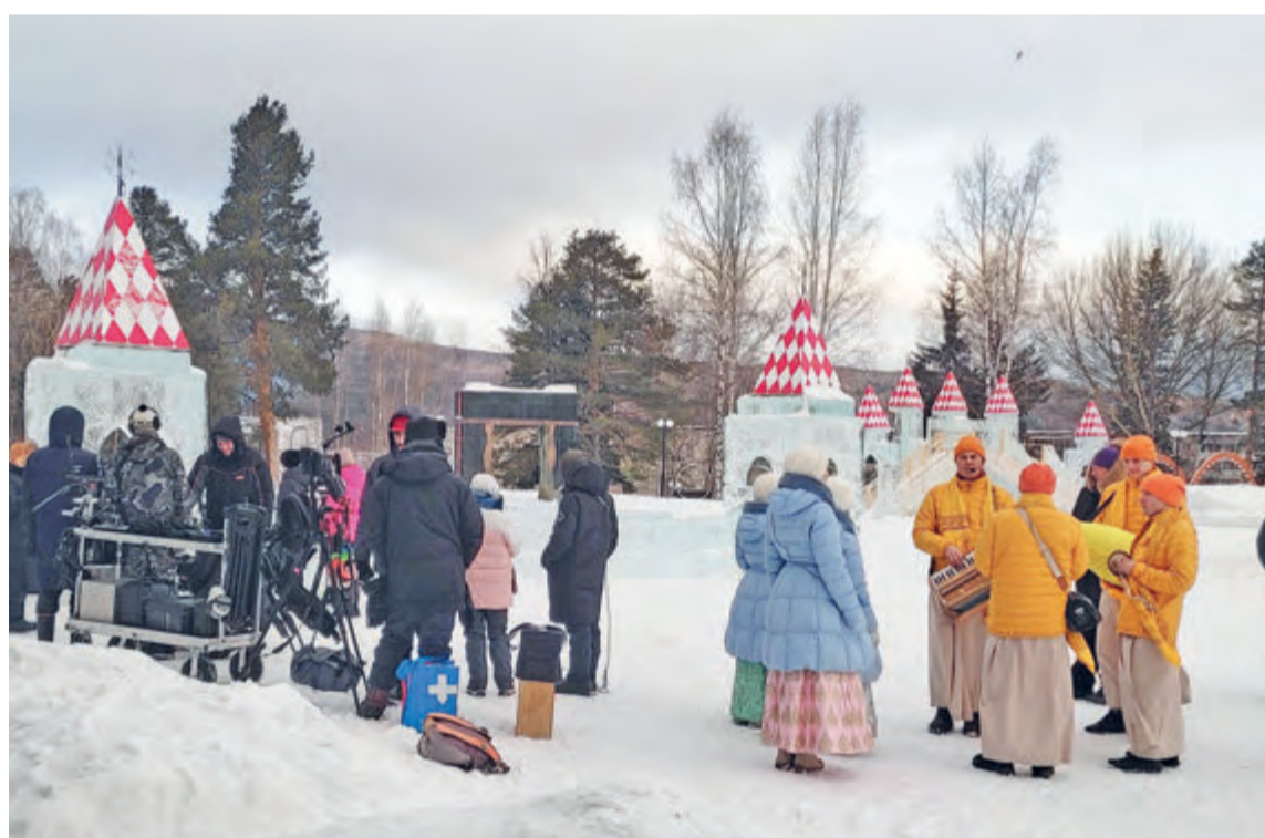
Яркими персонажами массовки стали кришнаиты из Екатеринбурга