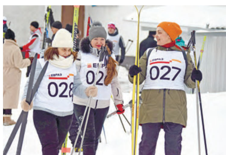
Улыбки не сходили с лиц участников