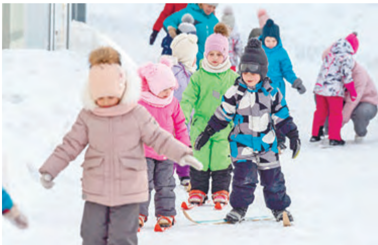
Воспитанники детского сада «Ладушки» получили заряд положительных эмоций