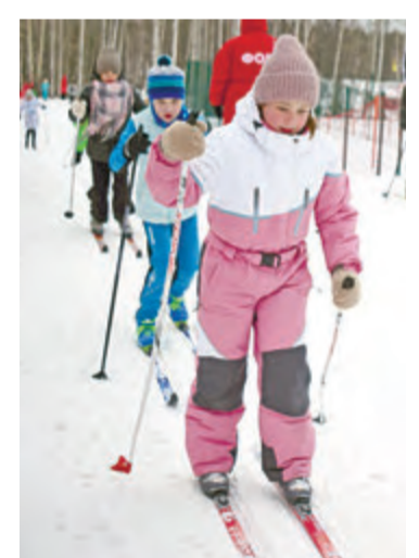
Еще немного — и финиш