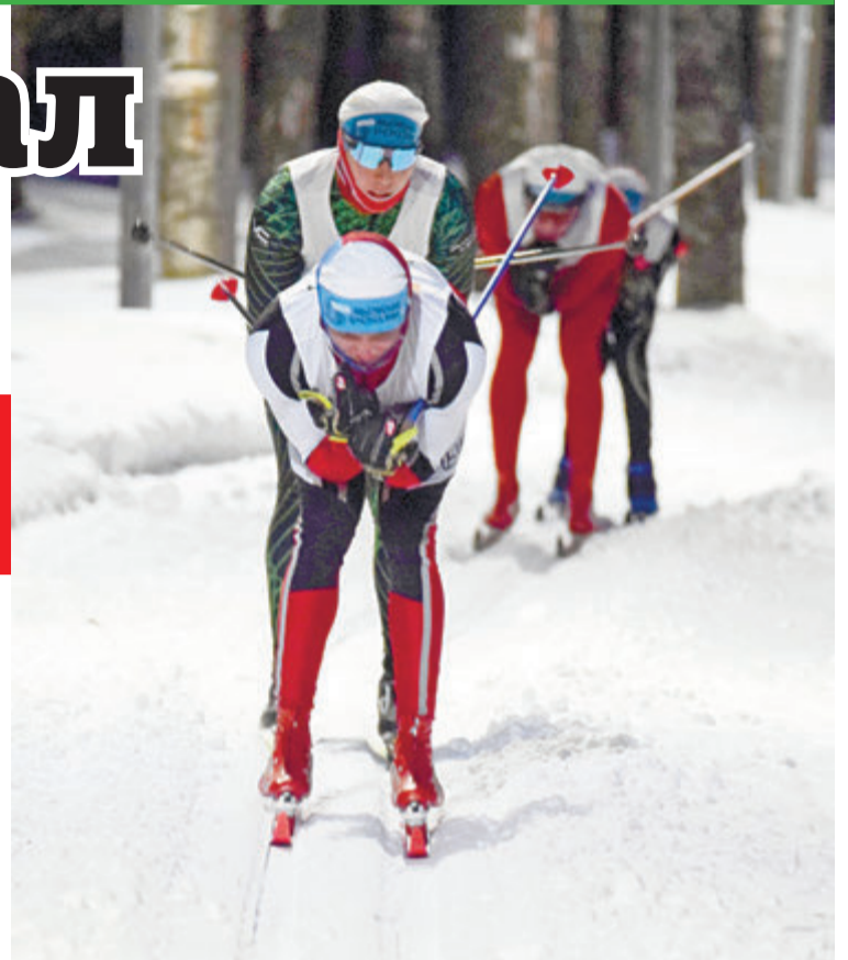
На лыже-роллерной трассе «Звёздочка» соревновались сильнейшие спортсмены