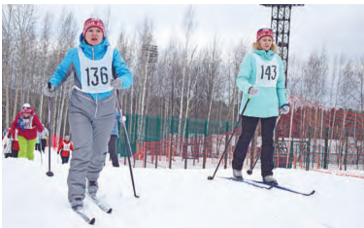
Главное не победа, а участие