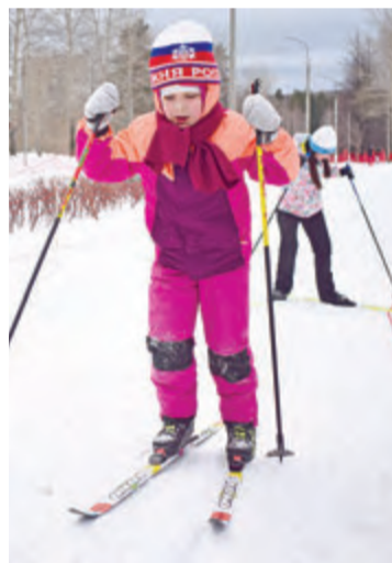
Вижу цель — не вижу преград